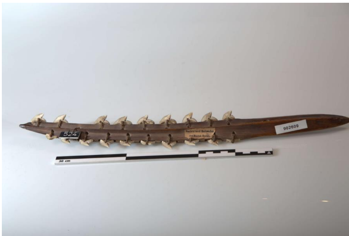
Figur 2: Sverd besatt med haitenner 2023 av Duncan Slarke 38

Sverdet laget av haitenner er og meget spennende. Hai er noe vi ikke ser i Norge og derfor blir dette en meget spennende gjenstand for folk flest å se på, enda mer så i andre halvdel av 1800 og derfor blir dette sverdet besatt med haitenner enda mer en raritet. Slik måte å lage sverd på er ikke kjent til Europa hvor vi i alle tider vi har kjent til har brukt sverd av jern og slike materialer.