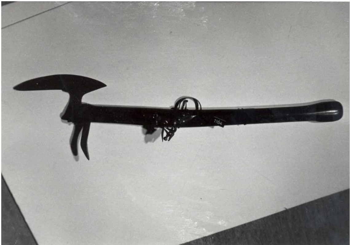
Figur 3: Karabin med flintlås, entrepigg og stridsøks, 2023 av Duncan Slarke 40

Dette er et våpen med flere forskjellige bruk. Både som skytevåpen og slagvåpen en kan bruke mot fiendtlige matroser. For utenvitende er dette våpenet meget spennende ved utseendet alene. Et våpen med tre bruksområder skaper interesse for marinelivet for utenforstående. Hvorvidt gjenstanden var sjelden på den tiden var nok ikke tilfellet, men et par andre gjenstander fra våpensamlingen til Kaptein Klinck skiller seg ut. Dette er gjenstandene fra Tordenskjold som består av hans pistol og hans drikkebeholder. Måten de skiller seg ut på er at de er med i samlingen mer enn annet basert på navnet til Tordenskjold enn bare selve objektene. En hvilken som helst pistol kunne blitt plassert i Klincks samling fra den tiden for å gi et bilde av hvordan våpen på Tordenskjold sin tid så ut. Men det som gjør pistolen og drikkebeholderen så interessant er det at den var eid av nettopp Tordenskjold, og at de med sannsynlighet ikke ville vært der hadde ikke hans navn vært knyttet med dem. Tordenskjold som et kjent navn i marine sammenheng vil klart sette sitt preg over en samling som er samlet av en marine offiser selv. Både Klinck og Tordenskjold kjempet under det samme flagget.