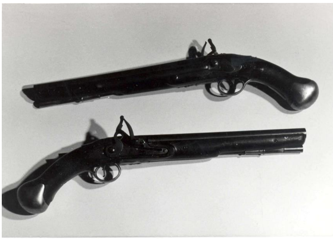
Figur 1: Tower marinepistol 2023 av Duncan Slarke 32

pistolene, innskrevet bokstavene «G.R» og Tower innskrevet på pistolgrepet. Dette avkrefter påstanden om at den er norsk produsert da «G.R» vil stå for George Regina da George III var konge av Storbritannia på denne tiden og dessuten var det ingen monark på denne tiden som startet på bokstaven G. 30 Det at det er inngravert «Tower» like på jernplaten til våpenet vil mest sannsynlig vise til at den er produsert på «Tower of London Armoury». 31 Kronen vil og indikere at den er kjøpt av den britiske kronen og er en måte å fortelle at den er eiendommen til kronen. Det at denne pistolen så og si er identisk med de samme markeringene som andre slike pistoler vil forsterke dette. Det britiske monarkiet har en tradisjon med å markere forbokstaven til den regjerende monarken og bokstaven R på gjenstander. Dessverre står det svært lite mer på databasen til marinemuseet annet enn lengdene på pistolene og løpet som ikke har noe med denne oppgaven å gjøre.