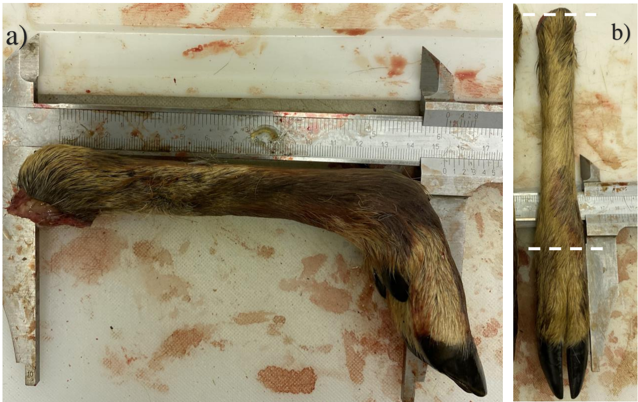
Figur 3.a) Demonstrasjon av hvordan framfoten ble målt. b) Illustrasjon over omtrent hvor metacarpus ligger, og de hvite stiplede linjene beskriver hvor framfoten som ble målt fra topp til bunn.

For å aldersbestemme rådyrene ble tannslitasjen på kjeven kikket på, samt avlesing av tannsnitt. Tannslitasjen gir liten informasjon om nøyaktig alder på individ nivå da det finnes variasjoner i slitasjen innenfor samme alderskategori (Aitken, 1975), dermed ble tannslitasjen brukt for å dele rådyrene inn i kategorier. Rådyrene ble delt inn i 3 eksisterende kategorier etter hvor mye slitasje tennene hadde, og om den tredje tannen forfra (premolar) var tredelt eller todelt (figur 3b). Var tannen tredelt ble den kategorisert som årets kje og fikk verdien 1 i datasettet, mindre slitasje og todelt tann ble kategorisert som 1 \frac{1}{2} år og fikk verdien 2 i datasettet, og tydelig slitasje ble kategorisert som eldre enn 2 år med verdien 3. Disse kategoriene ble brukt fordi det er sånn inndelingen er i hjorteviltregisteret.