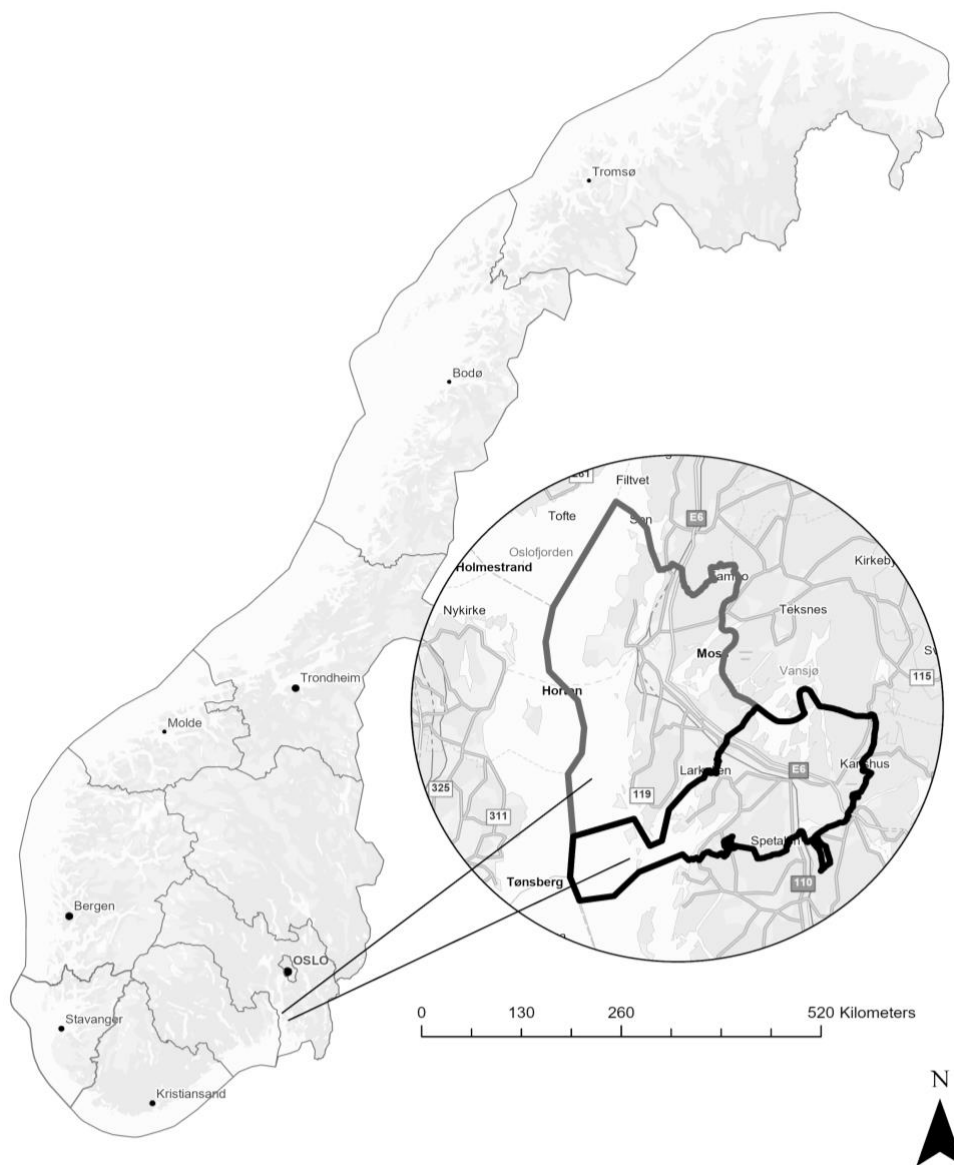
Figur 1. Kartutsnitt av Moss (markert med grått omriss) og Råde kommune (markert med sort omriss), Viken fylkeskommune i 2022. Kartet ble utarbeidet i Arc gis pro 2.6.1.