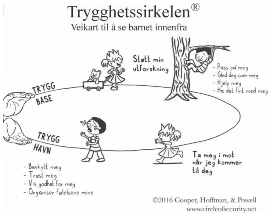
(Figur 1. Circle of security, 2016, Cooper et al.)