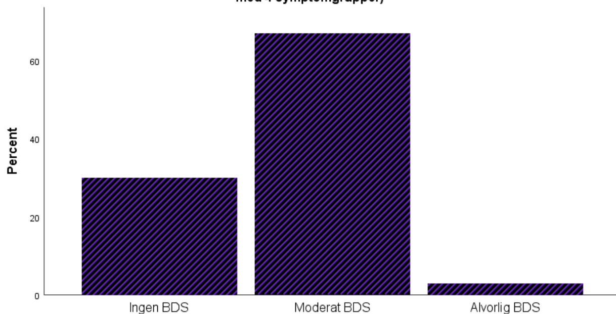
BDS sjekkliste tolket til 0=ingen BDS, 1=moderat BDS (med 1-3 symptomgrupper) og 2=alvorlig BDS med 4 symptomgrupper)