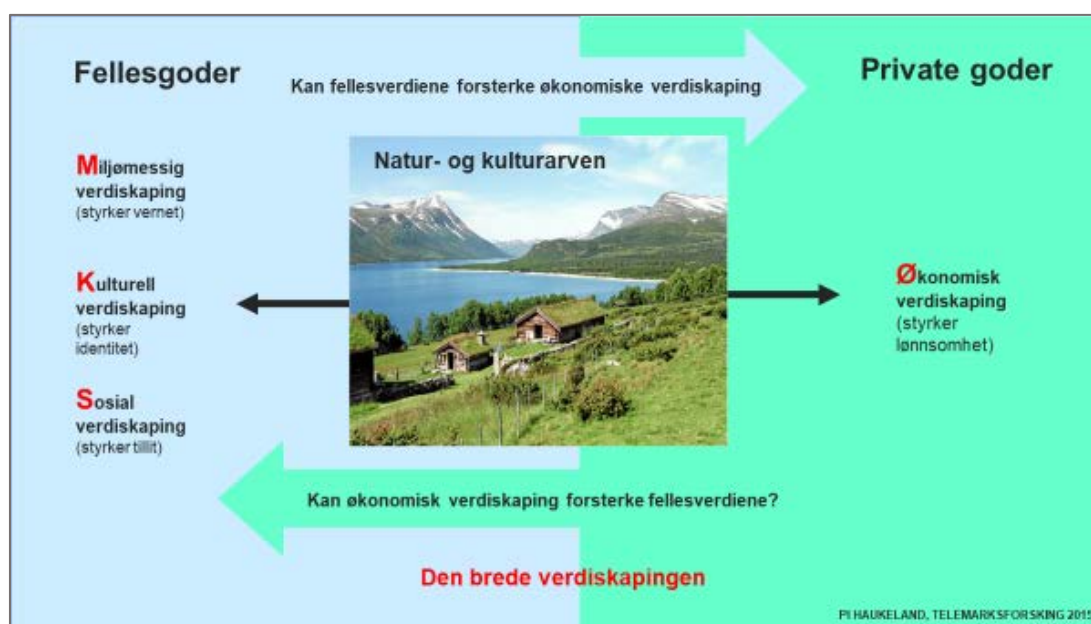
Figur 1 Forholdet mellom fellesgoder og private goder

Mange aktører er involvert i dynamikken mellom private goder og fellesgoder. Prosjektene skal vise hvorvidt det går an å utvikle en «vinn-vinn» mellom bruk og vern, og vise at privat bruk av fellesgodene ikke privatiserer dem og ender opp i et «vinn-tap», der enten vernet eller bruken forringes. Figur 1 viser en illustrasjon på forholdet mellom fellesgoder og private goder som vi har brukt på Telemarksforskning i flere år, og som her er knyttet til de ulike verdiskapingsformene.