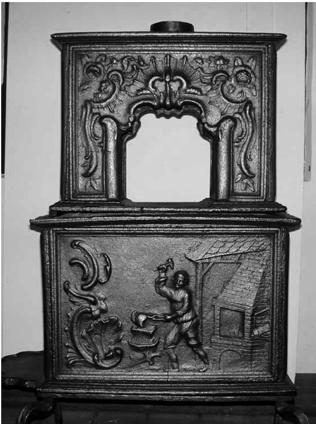
Ovn fra 1756, som viser Vulkan som våpensmed.