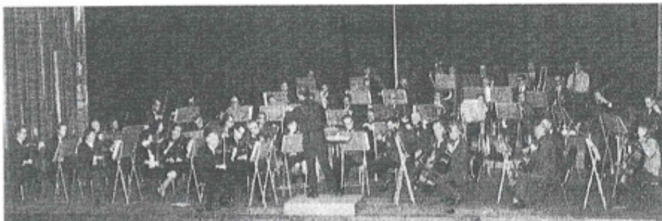
Vestfold Symfoniorkester. (Fotografert ved en prøve i Hotel Klubbens Konsertsal.)