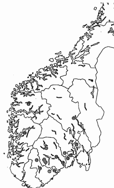
Kartet viser de stedene i Norge hvor det forekommer sagn eller skriftlige belegg for prestedrap.

Drøftinga har vist at telemarkingenes folkereligøse aktivitet knyttet til kirkebyggingen eller kirkeområdet inngår i et større folkereligøst atferdsmønster og atferdskompleks som vi finner igjen andre steder i landet. Denne type av folkereligøse atferd må sees på som et uttrykk for menighetens ønske om personlig og direkte kontakt med Gud eller en helgen. De skikkene vi her har behandla er alle belagt i etterreformatorisk tid, men lovekirke- og votivgaveskikken har forbindelseslinjer tilbake til katolsk tid. Katolisismen hadde flere institusjonaliserte muligheter for et aktivt personlig og di-