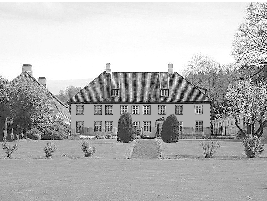
Hovedgården ved Nes Jernverk slik den ser ut i dag. I fløyen til venstre hadde Jacob Aall sitt bibliotek og arbeidsværkelse.