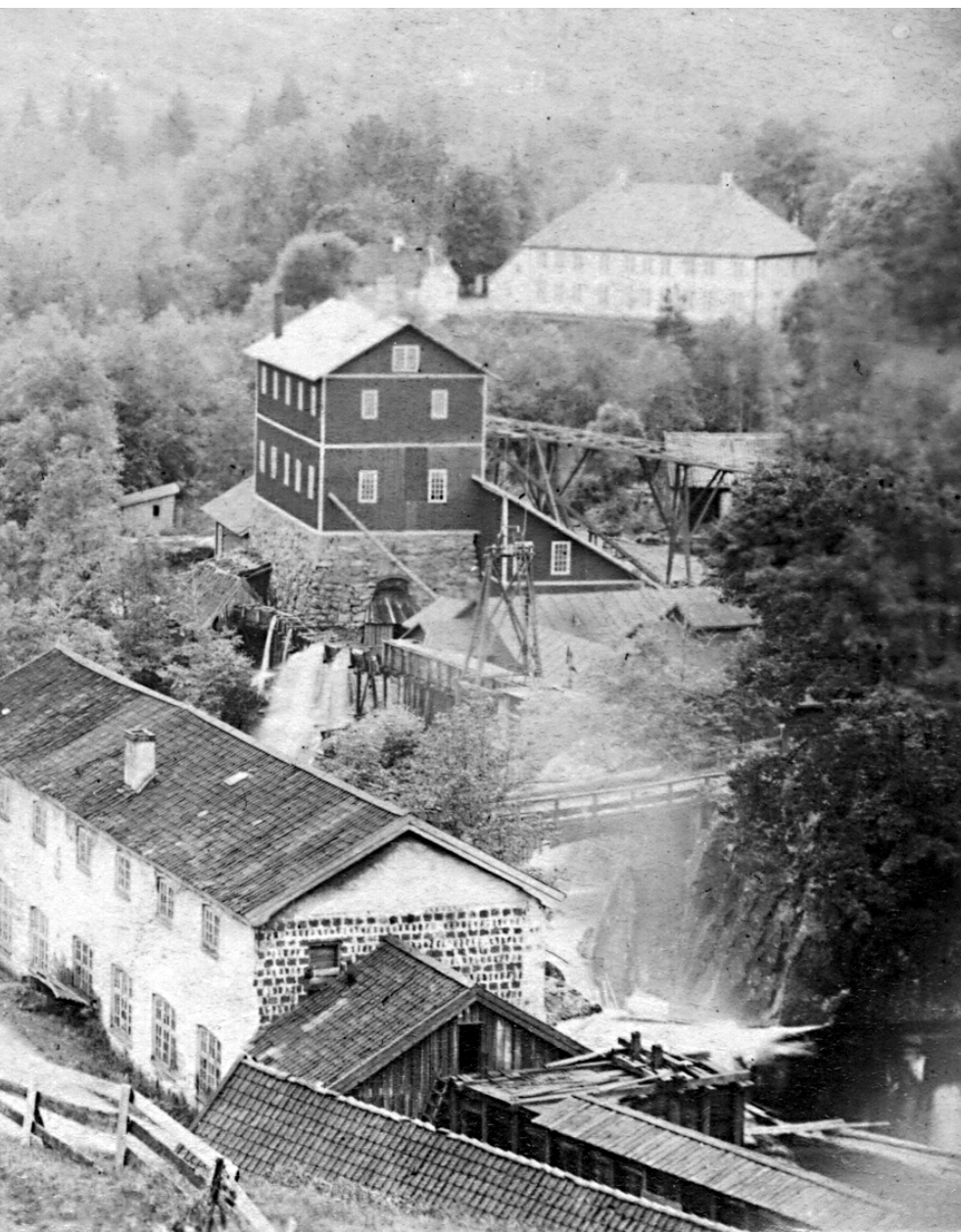
Et av de første bildene av Næs Jernverk. 1860. Næs Jernverksmuseums bildesamling.