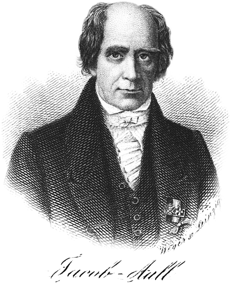
Jacob Aall (1774-1844).