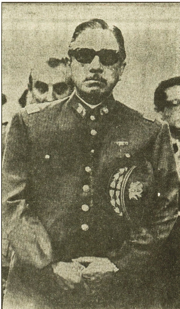
Bilde 2. Først i 2001–2005 ble Augusto Pinochet forsøkt stilt for retten, men han døde før han fikk noen dom.

ner i perioden frem til 1951–1952 etterforsket, de fleste på grunn av mistanke om straffbart landssvik. 11 Selv om oppgjørets hoveddel da var avsluttet, kom landssviksaker opp i Høyesterett frem til midten av 1960-årene. Omkring 2/3 av alle sakene under oppgjøret gjaldt NS-medlemskap eller frivillig fronttjeneste på tysk side. Rettsoppgjøret var først og fremst et oppgjør med partiet NS, i stor grad etter et prinsipp om kollektiv skyld. 12