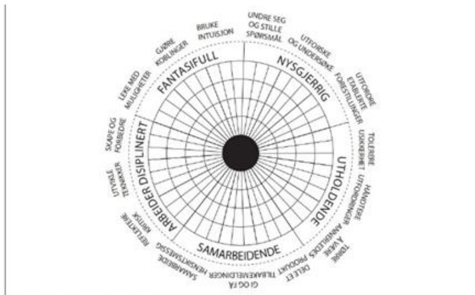
Figur 2.5 Definisjon av kreativitet

kreativitet var noko av det som vart delt med CEDETI i 2016, og som dermed har vore viktig i etableringa av KÅL.