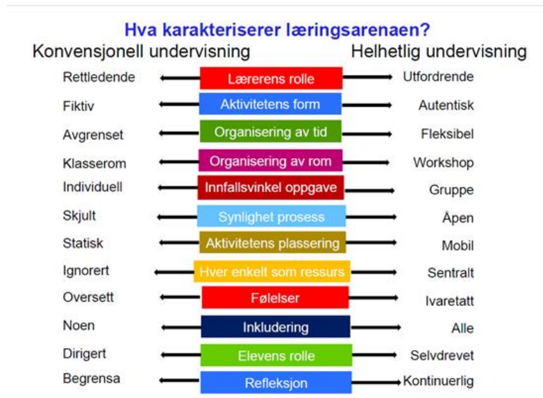
Figur 2: Heilskapleg undervisning-modell

Eg vil i det vidare arbeidet referere til høvesvis kognitive og performative læringsprosessar, men bruke materiale frå både Østern, Selander og Østern og Thomson / CCE.