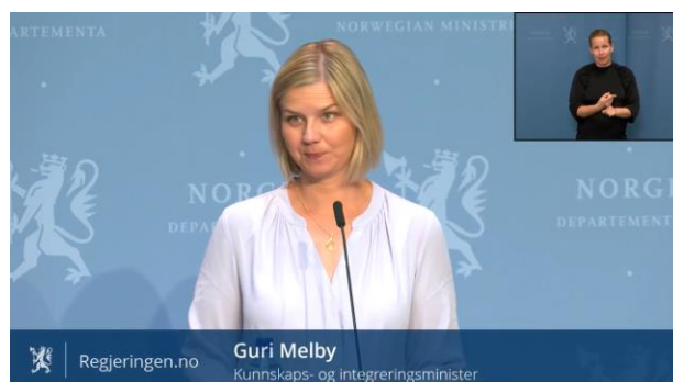
Figur 5 Guri Melby 11.08.20

Melby stiller til pressekonferansen i en hvit sommerkjole, passende for anledningen. Hun innleder med å skildre en skolestart slik den fortoner seg under normale omstendigheter. Derneft adresserer hun den uroen som mange kanskje kan kjenne på, for fortsatt er ikke alt helt som normalt. Målet er likevel å holde skolene åpne, og hun forklarer systemet de har for at det skal kunne la seg gjøre: trafikklysmodellen og veilederen. Hun forteller at det har vært noen tilfeller av smitteutbrudd som har ført til stenging av barnehager og SFO, men at trafikklysmodellen er laget for at man skal kunne holde åpent selv om det er lokale smitteoppblomstringer. Og det skal de gjøre sitt ytterste for å få til. Skole og barnehage er viktig for barna. Deretter presenterer hun hvilke forventninger de har til de ansatte og gir dem skryt for den jobben de la ned i våres. Alle som har vært med på vårens og sommerens dugnad, som resulterte i at smittetallene nå er lave, får også skryt. Avslutningsvis minner hun om reglene som fortsatt gjelder: vask hender, hold avstand, host i armkroken og holde deg hjemme ved sykdom.