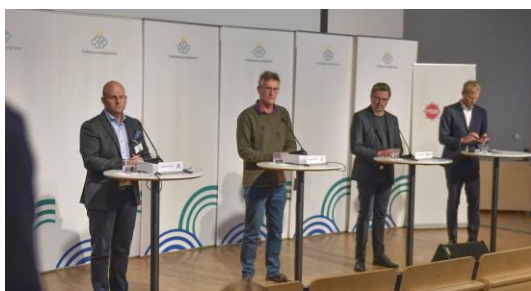
Figur 2 Sveriges pressekonferanse