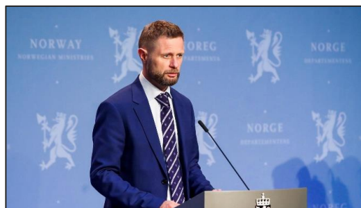
Figur 1 Bent Høie på pressekonferanse