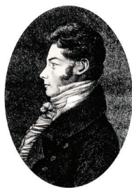
Figur 1: Christen Smith (1785–1816). Udatert kobberstikk utført av Heinrich August Grosch (1763–1843).

Christen Smiths (1785–1816) mest aktive år må ses i lys av de vanskelige tidene i Norge i årene før grunnloven ble undertegnet i 1814. Fra 1807 hadde den ene krisen avløst den andre, og hindret folk i å få maten de trengte. Det var barkebrødstid, og i mangel på korn måtte folk spe bark og mose i brødet. Det var flere grunner til at folk hadde det så trangt. En årsak kunne skrives tilbake til Napoleons-