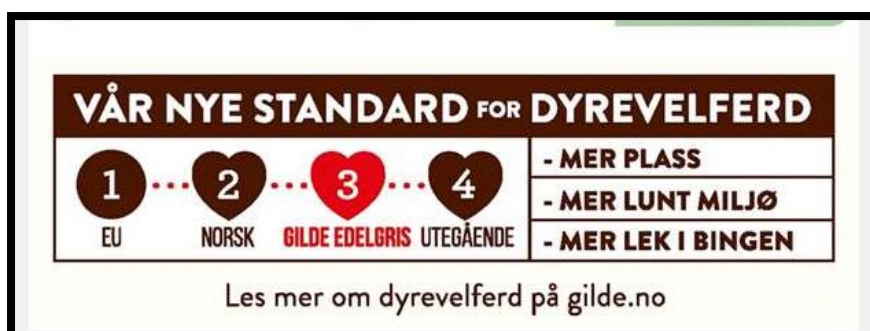
Illustrasjon 2: «Norturas nye standard for dyrevelferd» (Nortura 2018)

Året etter kom Nortura med ordningen «Griseløftet» – hvor forbrukerne fikk se en reklamefilm på TV og andre medier (Nortura 2018). Denne viser en bonde som går omkring på tunet bærende på en gris, og snakker om dyrevelferd. Forbrukerne blir fortalt at kjøttprodukter som er merket «Gilde Edelgris», kommer fra dyr som har hatt dyrevelferd som er bedre enn forskriftskravene. De skal blant annet få utfolde seg på 15 % større plass i bingen, og ha mer rotemateriale å leke med enn «konvensjonell gris». På disse produktene blir det også plassert en «dyrevelferdsindikator» (se bilde under):