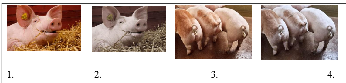
Illustrasjon 1 - Fotografier (Norsvin 2019) som er redigert i Word av Tone Sæter

Som jeg har beskrevet i innledningen har det oppstått et informasjonsvakuum mellom publikum og landbruket, og hva dette vakuumet fylles opp med har mediene en rolle i. I filmen hevdes det at den ikke har noen agenda ut over å få frem hvordan virkeligheten ser ut i svineproduksjonen, slik at praksis kan endres. Den slår altså fast at praksisen den viser er vanlig i alle svinebesetninger. Motargumenter imøtegår allerede i filmen, ved at det gjentas at bransjen kommer til å si at dette ikke er tilfellet i vanlige svinebesetninger. Det faktumet at de har filmet skjult i mange år og klippet sammen de verste opptakene blir det ikke gjort noe ut av.