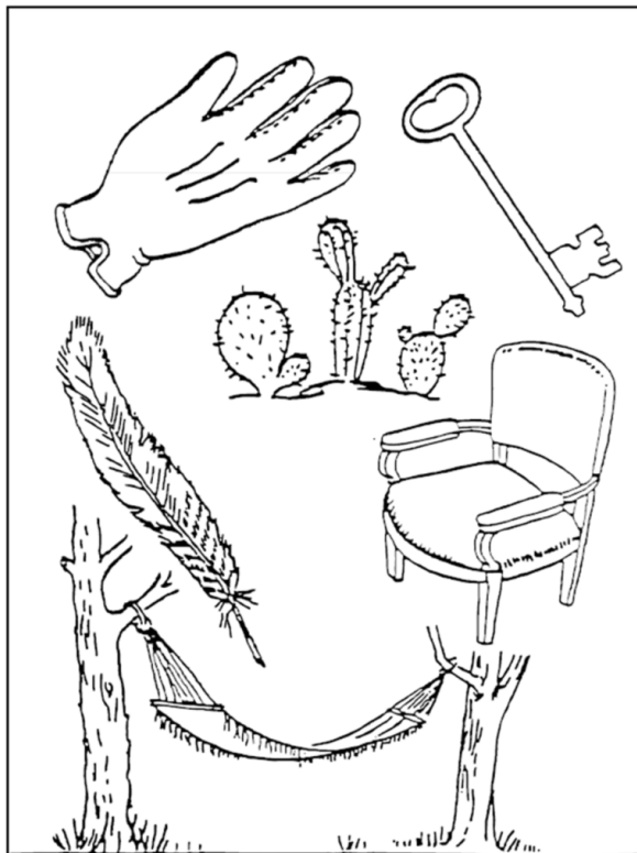
Figur 2. Bilder fra det originale NIHSS-skjemaet

Ekspertgruppen var enig om å beholde alle de amerikanske bildene da de er gjenkjennelige i norsk kultur. Bildet av en hanske kan tolkes som en hånd, og det blir godtatt som riktig svar i originalversjonen (7). Figur 2 og 3 viser bildene fra originalversjonen av amerikansk NIHSS, som alle ble beholdt i den norske validerte versjonen.