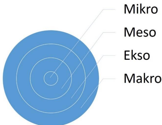
Figur 2 Bronfenbrenners utviklingsøkologiske modell

Forståelsen av gjensidig sammenheng gjør modellen nyttig som forståelsesramme for nærmiljøets betydning for barns utvikling (Rønningen, 2003). For utsatt ungdom er grenseflatene mellom mikrosystemene, meso-nivået , viktig for sosial integrasjon lokalt (Båtevik, Kvalsund, & Myklebust, 2020). Samfunnsfaktorenes betydning vises også gjennom helsefremmende arbeids framvekst fra 70-tallet til Helsinki-erklæringen: Helse i all politikk (WHO, 1978, 2014). Regjeringens kunnskapsportal mot radikaliserings og voldelig ekstremisme, www.utveier.no , refererer Bronfenbrenner og viktigheten av ungdoms tilknytning til samfunnet (RVTS Øst, 2017).