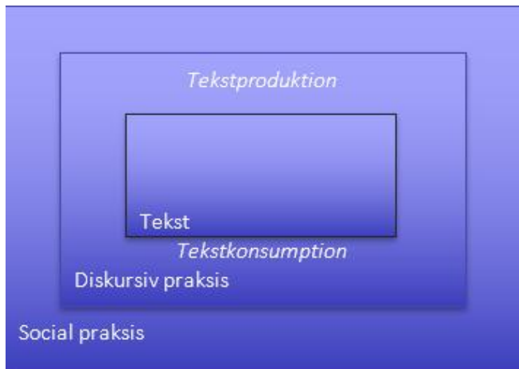
Figur 1: Faircloughs tre-dimensionelle model for kritisk diskursanalyse (CDA) (Fairclough, 2008, s. 29).