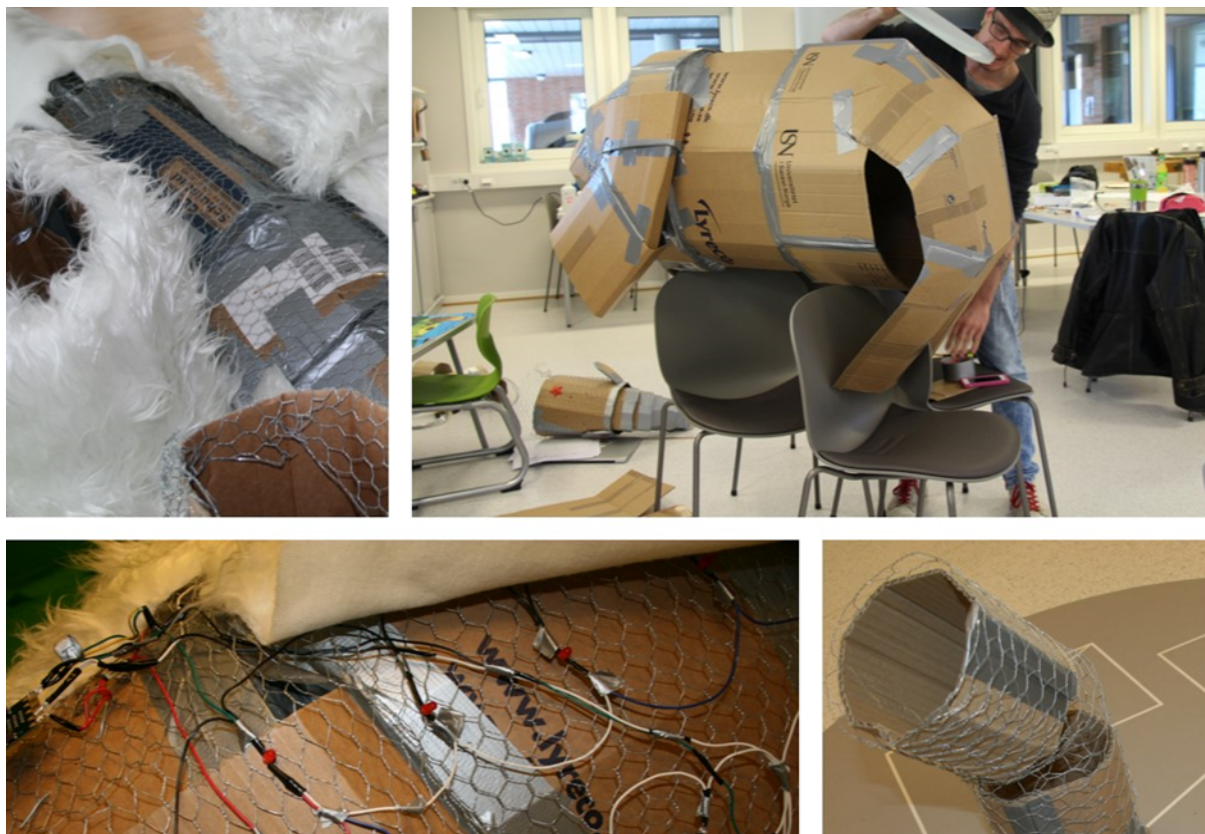
BILDE 3. Ein isbjørn blir til, med nettverk av lys under fuskepelsen.

I mengda av gode løysingar kunne me valt å trekke fram fleire, men av omsyn til den tilmålte plassen i artikkelen gjer me eit utval ut ifrå den største og den minste løysinga. Desse to er fine kontrastar på fleire måtar og dekker godt breidda i det som utspelte seg i perioden.