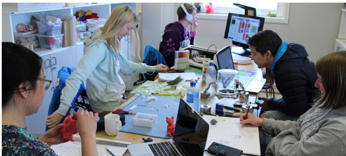
BILDE 1. Felles ideprosess, Skaparverkstad, 2019.