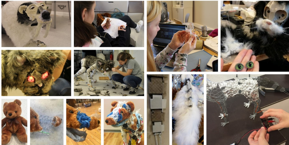
BILDE 2. Arbeid med lysande laserauger, bamse transformert til plashund, demontering av elektroniske leikedyr, 3D-print av fiskehale, programmering av rørsle i hovud og ledda hale.