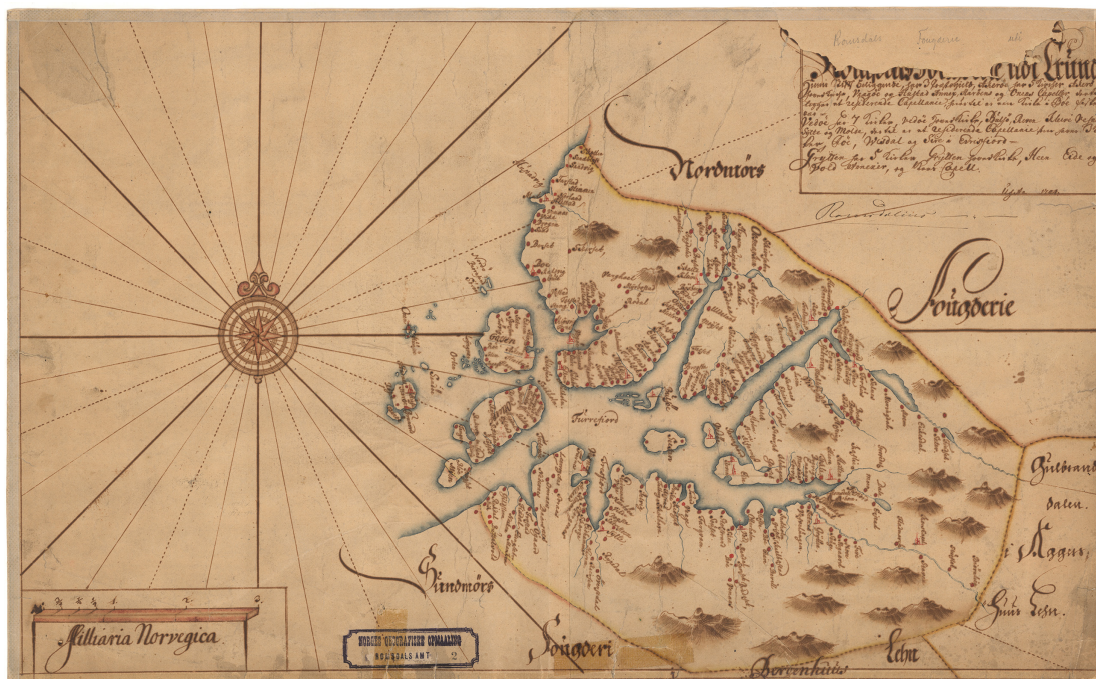
Illustrasjon 5: Romsdals fogderi i Romsdals Amt, kart frå 1704. Uksnøy låg midt mellom Sunnmøre og Romsdal, og folk frå begge fogderi tok del i dugnaden rundt «Albion». Øya Oxenøe kan skimtast i øygruppa nærmast kompasset i venstre hjørne. Mjelva kom frå Grytten, der fjorden møter dei massive romsdalsfjella og elva Rauma, nedst i høgre hjørne.

Det var altså ikkje uvanleg at folk på byrjinga av 1800-talet forsøkte å få tak i varer ved tjuveri på grunn av armod. 93 Situasjonen for allmugen rundt Uksnøy var prega av middels til dårlege høve for dyrking og beite. Dei hadde riktig nok det ressursrike havet rundt seg. 94 Men matforsyninga var til ein viss grad vilkårleg – det var ikkje alltid godt fiske. Dessutan låg fleire fiskever langs kysten i Romsdal under styringa til kjøpmenn som hadde forkjøpsrett på rå fisk herfrå; dei var vereigarar og hadde verrettar, som gjekk på akkord med fridomen til fiskarane. 95 Kjøpmennene fekk stor fortjeneste av dette, og tente store pengar i spanketida omkring 1830. 96 Deler av allmugen blei då fråtekne ein viktig kjelde til likviditet i