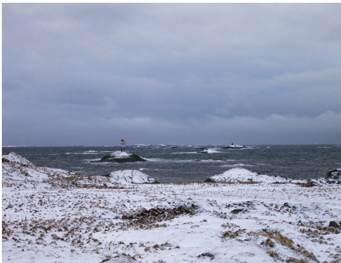
Illustrasjon 6: Uksnøy etter vinterstorm.

Ein ny kommisjon blei sett ned etter 1841, og saka kunne igjen bli behandla i Høgsterett 30. september 1843. Med få korreksjonar dømte Høgsterett alle dei gjenlevande 117 menneska til 2 til 6 månader tukthusstraff, dei 29 losane som var sikta mista losretten sin, og i tillegg skulle dei 117 dekke kostnadane i saka med nokre få unntak. 106 Forsvaret frå Mjelva strakk altså ikkje til når alt kom til alt. 107