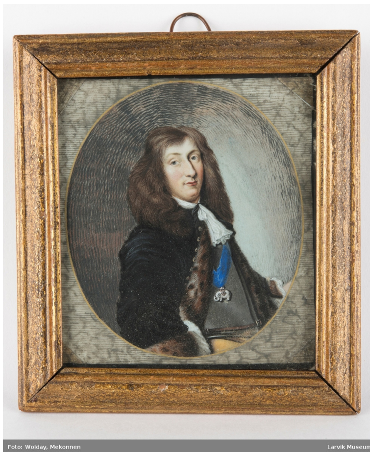
Illustrasjon 1. Ulrik Fredrik Gyldenløve.