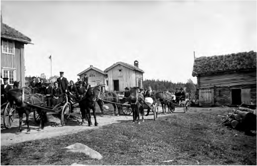
«Bryllupsfølge fra Setalid, Rauland». Spellemannen kan bare så vidt skimtes i bryllupsfølget