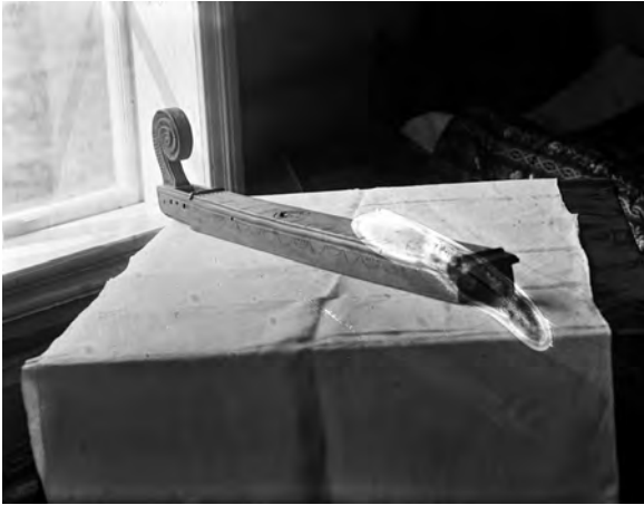
Det eneste gjenstands- fotografi av et musikkinstrument i fotosamlingen etter Berge er en langeleik, fotografert i Flåbygd i 1907.