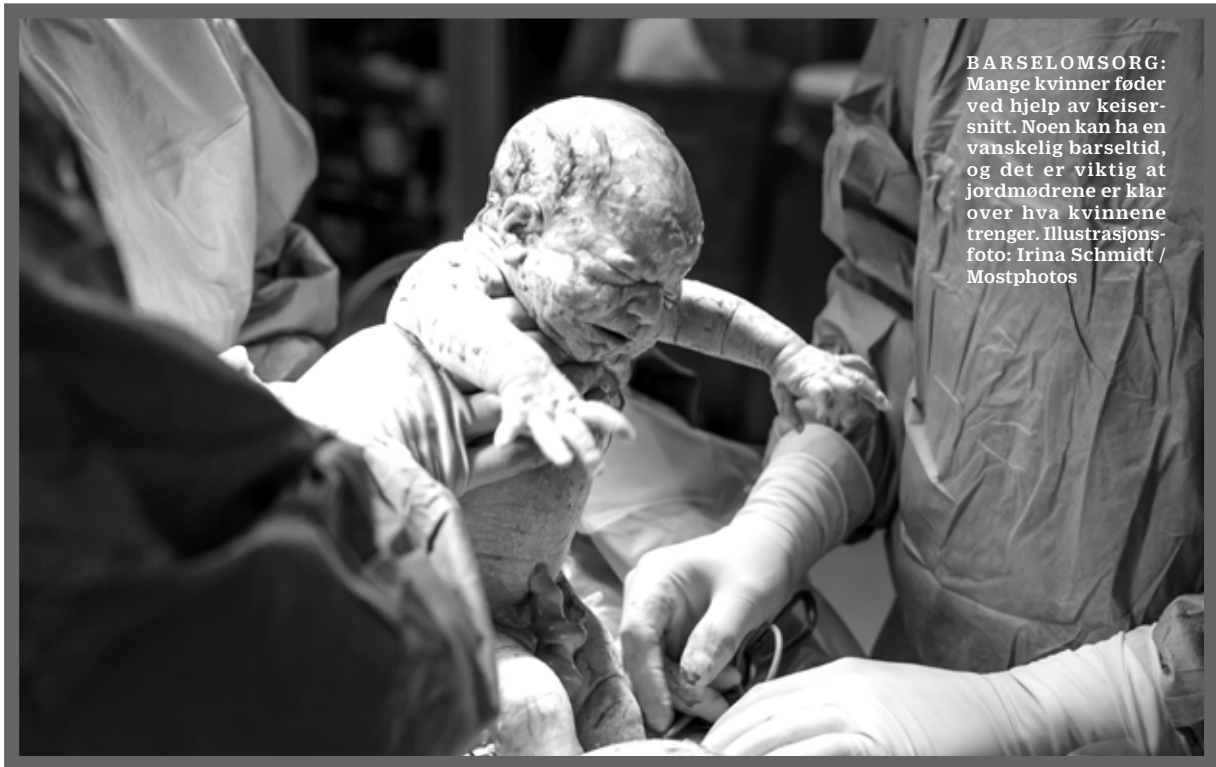
BARSELOMSORG: Mange kvinner føder ved hjelp av keisersnitt. Noen kan ha en vanskelig barseltid, og det er viktig at jordmødrene er klar over hva kvinnene trenger.