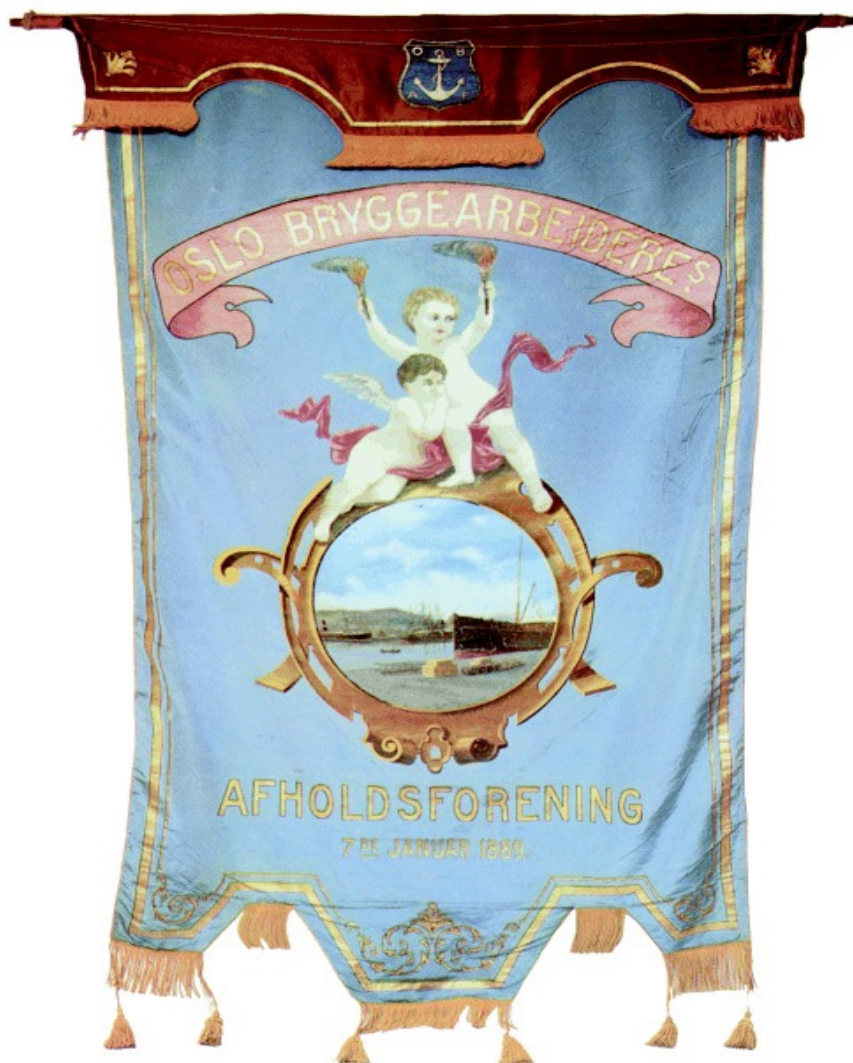
Bilde 3. Fanen til Oslo bryggearbeideres avholdsforening. På baksiden står «Gjennom kamp til seier».

hadde fått gjennomslag i byene, viser det faktum at i løpet av noen år på 1890-tallet ble samlagene i Telemark stemt ned ved folkeavstemninger, bortsett fra i Langesund. Samlagsmotstanderne sto altså sterkt i Telemark. I Skien stemte 60 prosent av byens innbyggere nei til samlaget i 1895, og i Kragerø gjorde 74 prosent av befolkningen det samme i 1898. 16 Også ved folkeavstemningen i Norge i 1919 støttet telemarkingene opp om avholdssaken. I Telemark gikk 76 prosent av innbyggerne inn for brennevinsforbudet, mens ja-prosenten i Norge som helhet lå på 61. I flere bygder, som Drangedal, Seljord, Nissedal, Fyresdal og Vinje, stemte mer enn 90 prosent av befolkningen ja til forbudet. I 1919 sluttet imidlertid byene i Telemark i mindre grad opp om forbudet enn bygdene. 17