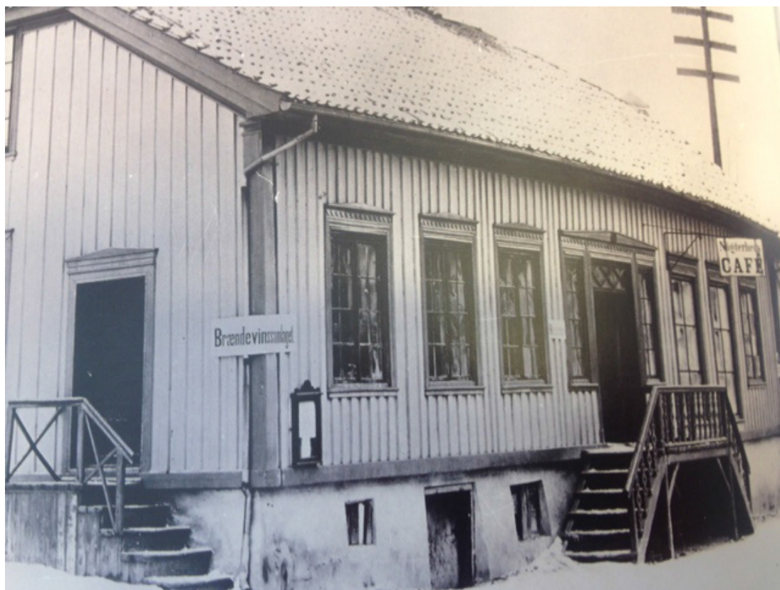
Bilde 4. Brennevinssamlag i Porsgrunn. Brennevinssamlaget hadde monopol på omsetning av brennevin fra opprettelsen i 1873 og fram til 1897 da samlaget ble nedlagt etter folkeavstemning.

andre fra og til deres Pladse vrøvlende i en Pokkers Tid. Jeg mærkede, at det var besværligt nok, at være den eneste ædru blandt saa mange Berusede. Brudgommen selv bar paa en Ruus den ganske Dag. 32