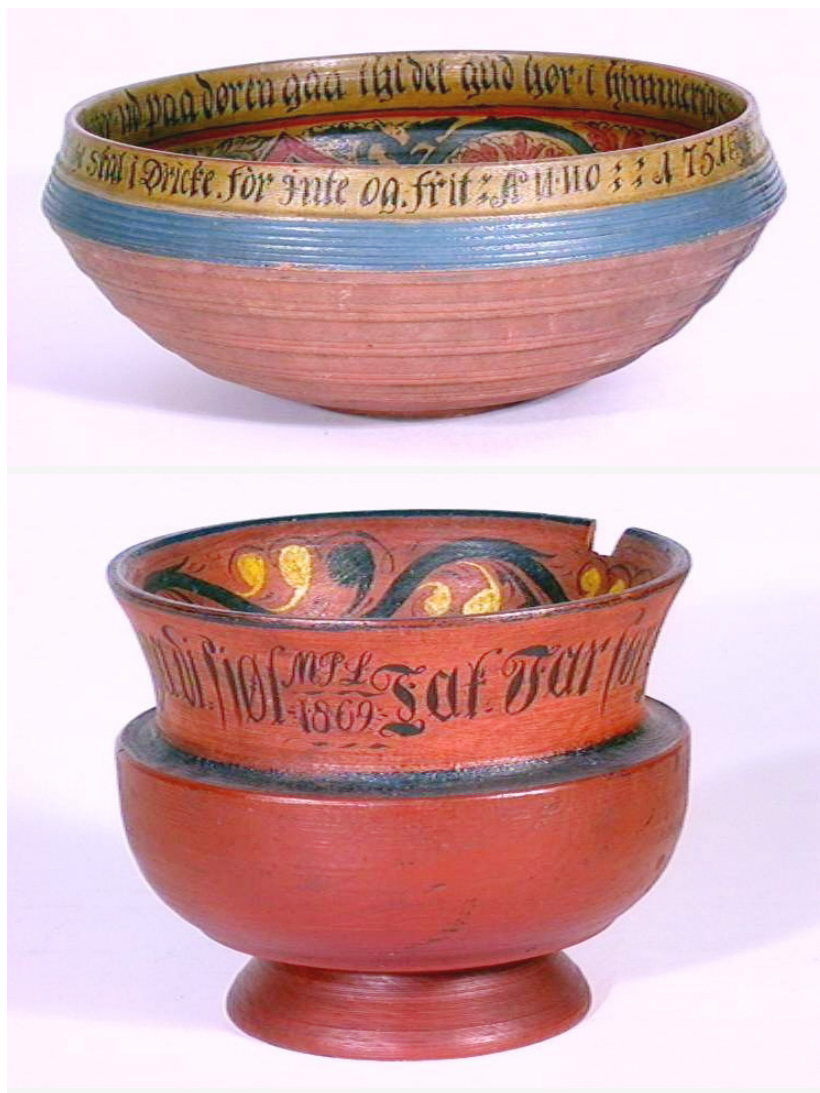
Bilde 1. Øboller fra Telemark. Øverst: «I dag Skienker verten for Penger vil ei vide af nogen chridet men i morgen i løstige drenge skal i Dricke for inte og frit. ANNO 1751». Nederst: «Tak far før got øl jeg skjøna at mor har brujga di sjøl: MPL 1869». Ukjente kunstnere.