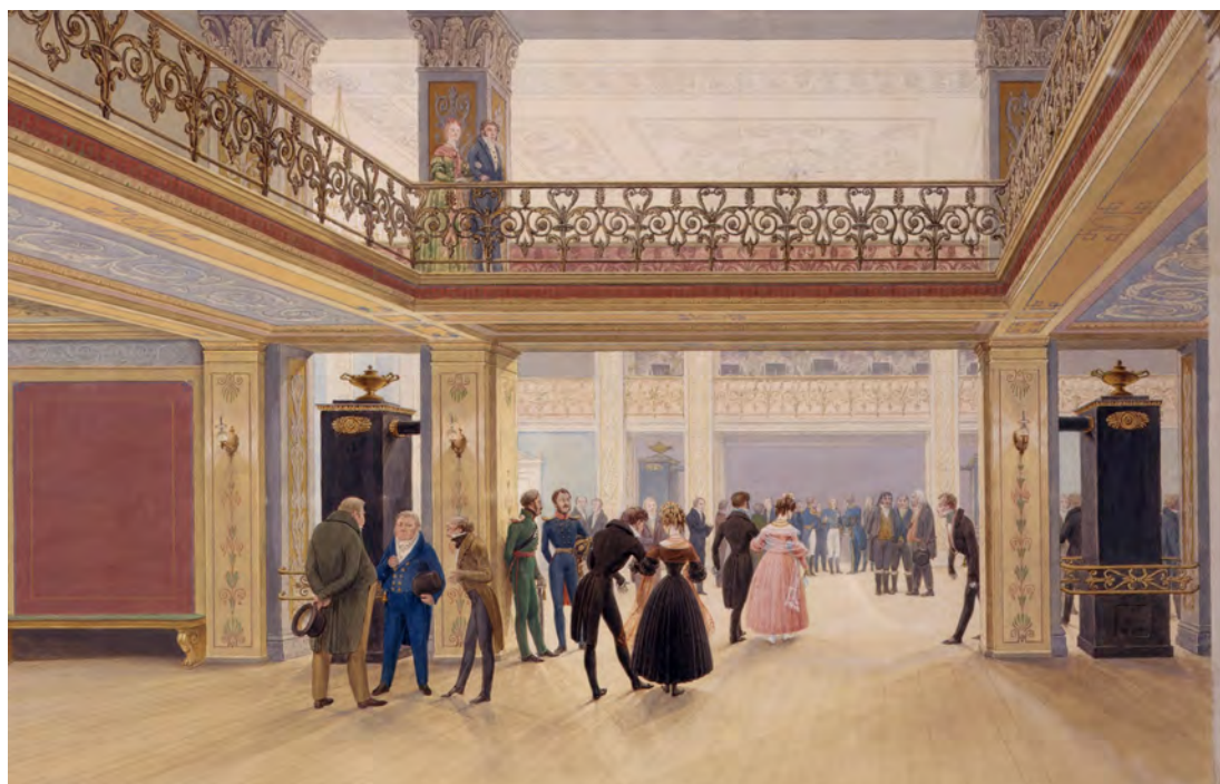
Fig. 5: Interiør fra et kongelig slott, ca. 1830, av Johannes Flintoe. Det dreier seg ikke om det kongelige slott i Christiania, som noen har ment, for det sto ferdig først i 1849. Men dette lett satiriske bildet kan Flintoe likevel ha hentet inspirasjon til i norske forhold. Personene i forgrunnen til venstre ligner i hvert fall ganske mye på solide stortingsbønder som har trådt inn i en verden av urban overklasse som i utgangspunktet var svært fremmed for dem. 82

En annen måte satirikerne sviktet sin rolle på, var ved å forstyrre og avlede den offentlige debatt fra essensielle temaer fordi de forelsket seg i sin egen estetiske og provokatoriske lek med ord og satiriske roller. Elitær arroganse og klovnete avsporing var ukulturen som snek seg inn og spente ben for satirikernes forsøk på å utvide den kritiske bevissthet. Dette var likevel for småtterier å regne i forhold til deres vedvarende opposisjonelle og kritiske inn-sats. Men det var ett tilfelle hvor Krydseren for alvor snublet inn i en ytterst ukledelig rolle som løpegutt for makthaverne, nemlig i behandlingen av Thranebevegelsen. Krydseren overøste den med hånsord, etter at den var blitt knekket av rettsapparatet. De skarpskodde satirikere ble i dette stykke det gamle regimets nyttige idioter.