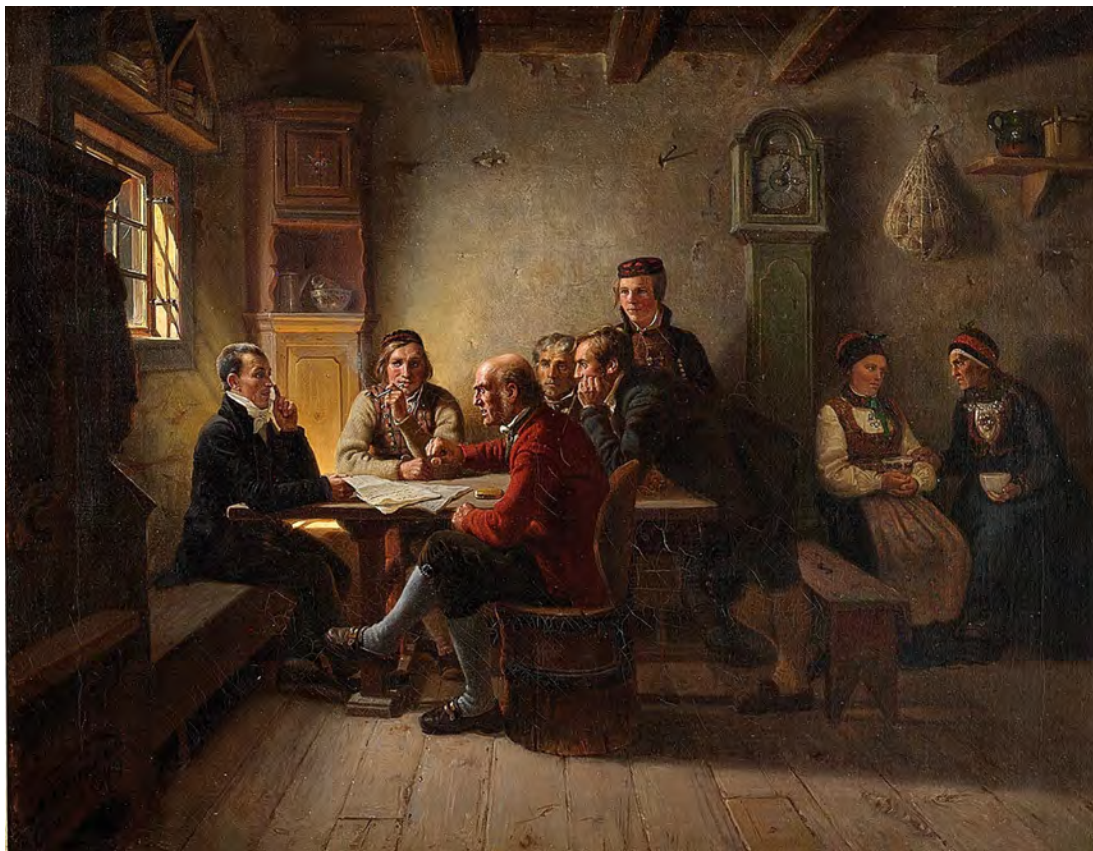
Fig. 1: Politiserende bønder: Slik fremstilte Adolph Tidemand et møte mellom politisk engasjerte bønder i 1848.

politiske aktører. Enkelte kom raskt i gang med et strategisk arbeid med mål om å skape en konsensus rundt bondesaker. 35