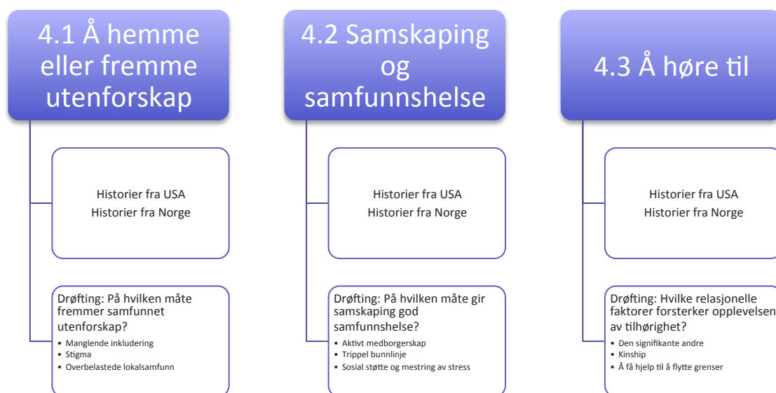
Figur 1-2 Oversikt over funn og drøfting

I denne delen skal jeg presentere mine funn. I avhandlingens bakerste del ligger et persongalleri som vedlegg. Grunnet mange informanter er det nyttig å lese dette først, og gjerne ha det ved siden av når analyse og funn skal leses. Informantene presenteres først i form av en enkel tabell, deretter følger en presentasjon av hver og én, satt i kontekst. Informantene er delt inn i amerikanske og norske. Med norsk mener jeg de som på nåværende tidspunkt er bosatt i Norge. Med amerikansk mener jeg de som på nåværende tidspunkt er bosatt i USA. Jeg har videre valgt å dele funnene inn i tre hovedkapitler, 4.1 “Å hemme eller fremme utenforskap”, 4.2 “Samskaping og samfunnshelse” og 4.3 “Å høre til.” Under hvert kapittel presenterer jeg først historier fra deltakere og sosialarbeidere i USA, disse oppsummeres i et lite sammendrag. Deretter kommer historier fra deltakere og sosialarbeidere i Norge. Disse oppsummeres også med et lite sammendrag for lettere å holde oversikt. Til slutt analyseres og drøftes historiene ved hjelp av ulike teorier og forskningsrapporter. Etter drøftingen avsluttes hvert kapittel med en kort oppsummering knyttet til problemstilling.