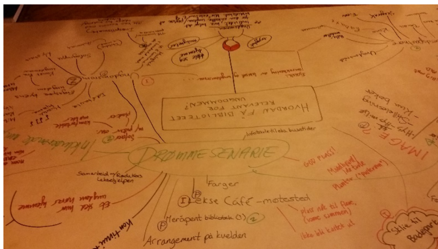
Bilde 1 Ungdommenes gigamap fra første workshop

umiddelbare tilbakemeldinger. Formålet var å ha en brainstorming for hva en ungdomssatsing i Pusterommets ånd kunne innebære, og samtidig frigjøre seg mest mulig fra vante forestillinger og fordommer knyttet til hva en ungdomssatsing kunne innebære. Man ble oppfordret til å tenkte stort, og samtidig i å tenkte systemer ved å se hvordan ulike elementer i ideer kunne henge sammen og underbygge hverandre. Gruppene jobbet sammen på store kart, som så kunne presenteres for hverandre.