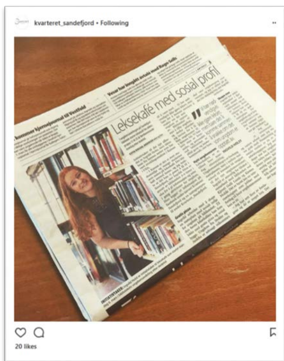
Bilde 11 Oppslag i lokalavisa, dokumentert på sosiale medier

og kompetanse på feltet. I det andre biblioteket har det vært en noe brattere læringskurve i å bruke sosiale medier til markedsføring. Utfordringen med å bruke sosiale medier til markedsføring er åpenbart at det er komplisert å nå ut til målgruppen, og sidene genererer foreløpig ikke mye aktivitet. Allikevel skal man ikke underkommunisere den effekten slik markedsføring kan ha på sikt. Prosjektet har også fått pressedeckning i Sandefjords blad og byavisa i Sandefjord, samt i Hortens lokalavis Gjengangeren.