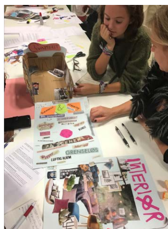
Bilde 2 Kreativt samarbeid for å utvikle ideer om interiøret i ungdomsrommene