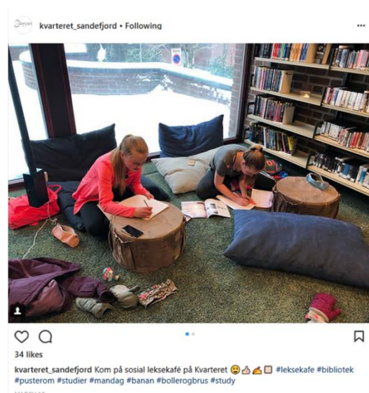
Bilde 8 Ukentlig leksecafe på Kvarteret har blitt en suksess