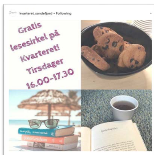
Bilde 9 Annonsering av lesesirkel for ungdom

Det er igangsatt en lesegruppe i Sandefjord bibliotek, basert på Shared Reading-metoden. En ansatt med kompetanse på metoden leser høyt fra utvalgt litteratur, og leder samtaler og diskusjon. Tiltaket er særlig tenkt som et bidrag til økt folkehelse, hvor det legges til rette for at unge deltar i reflekterende samtaler om meningsfulle temaer, i en trygg sosial setting. Hittil har det vært et lite antall unge som har vært faste deltakere i lesesirkelen.