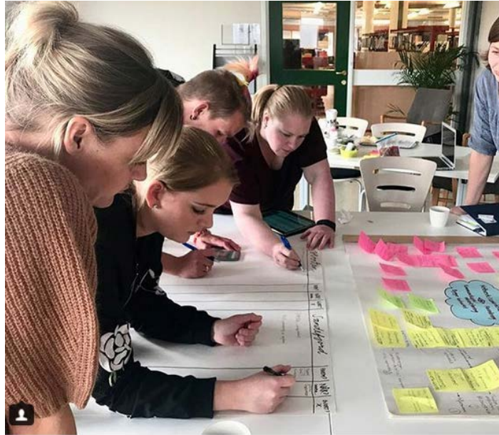
Bilde 12 Prosjektgruppen lager ny tidslinje for å planlegge nettverksbygging