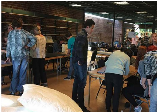
Bilde 6 Diskusjon av teppeprøver og puteverksted på ungdomsrommet