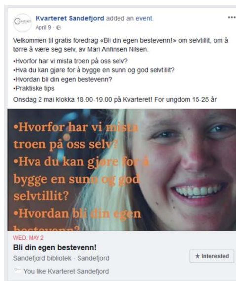
Bilde 7 Ytringsveggen i bruk, og annonsering av arrangement på Facebook