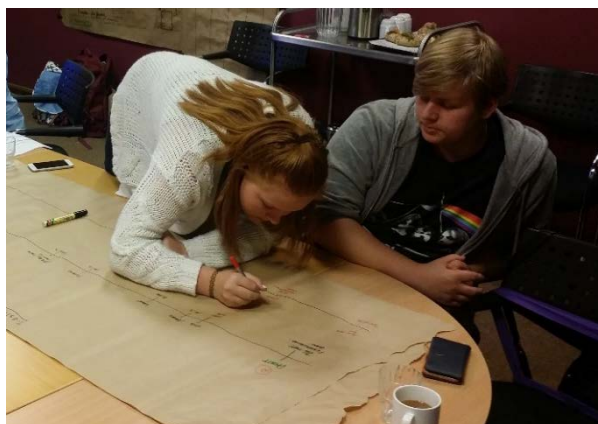
Bilde 4 Ungdommen lager tidslinje for å visualisere fremdriftsplaner

Siste fase var å utvikle detaljerte tidslinjer for å visualisere en fremdriftsplan for realisering av tiltakene. Langs tidslinjen ble deloppgaver som skulle iverksettes, tidsfrister og ansvarspersoner notert. På denne måten kunne alle prosjektmedarbeidere gjøres ansvarliges for sine ansvarsområder. Både gigamapper og tidslinjene ble tatt i bruk også på senere prosjektmøter, for å synliggjøre fremdriften i prosjektet.