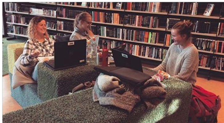
Bilde 5 Spesialsnekrede møbler i ungdomsavdelingene

I begge prosjektbiblioteker ble ungdom invitert inn for å delta i utviklingen av rommene. Under byggingen av rommene ble fremdriften stadig dokumentert via sosiale medier, og blant annet det arrangert puteverksted, hvor ungdom ble invitert inn bredt til for å sy puter til rommet.