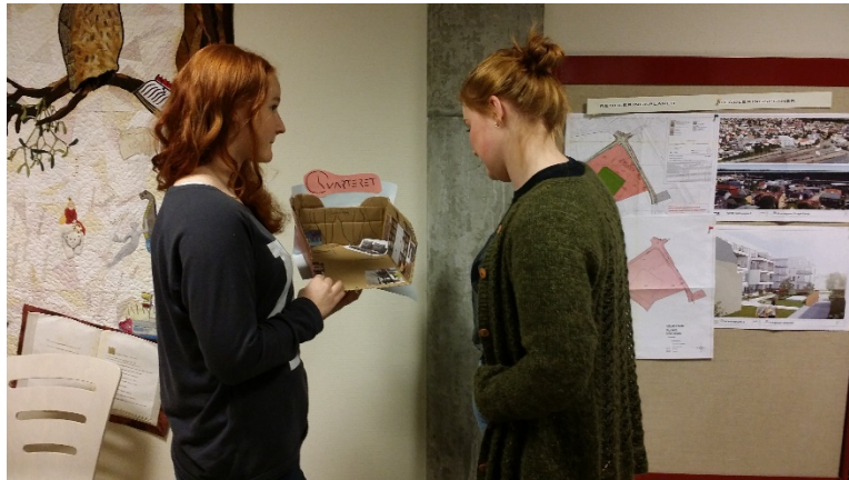
Bilde 3 Ungdommen trener på å presentere prototyper for hverandre

Et verktøy som ble benyttet som et ledd i prosessen var utviklingen av prototyper. I denne sammenhengen fungerer prototypen som en første forsøksvise utforming av en konkret ide, som kan testes ut i et lite format, for deretter å kunne vurderes og eventuelt videreutvikles. Et annet verktøy som ble introdusert var strategier for å samle inn brukererfaringer og synspunkter på ideer og prototyper, gjennom intervjuer, observasjon i testsituasjoner eller spørreundersøkelser. Blant annet trente ungdommen fra de ulike bibliotekene med hverandre på hvordan de kunne ta med seg mindre prototyper eller skisser ut i møte med målgruppen, for å få tilbakemeldinger.