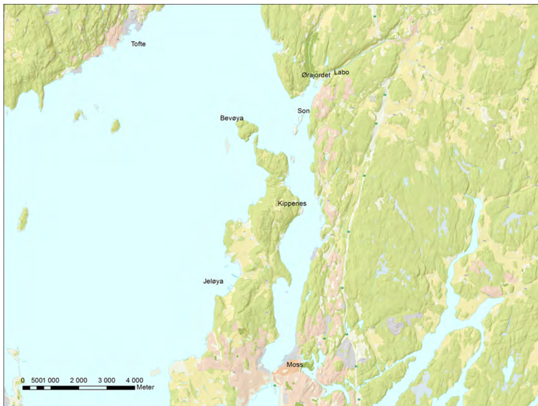
Figur 1: Son og omegn. Kart: Reidun M. Aasheim. Akershus fylkeskommune. Kartgrunnlag: Kartverket, Geovekst og kommunene.

De siste årene har forfatterne av denne artikkelen – to arkeologer og en historiker – arbeidet sammen for å avdekke mest mulig av Sons forhistorie og ladestedets historie fram til midten av 1700-tallet. Undersøkelsen kan betraktes som et pilotprosjekt for et tett, tverrfaglig samarbeid om utforskningen av et middelalderlig handelssted og en tidligmoderne småby. Denne artikkelen vil fokusere på hva dette tverrfaglige samarbeidet har gitt av «merkunnskap» om Son, spesielt for den etterreformatoriske perioden.