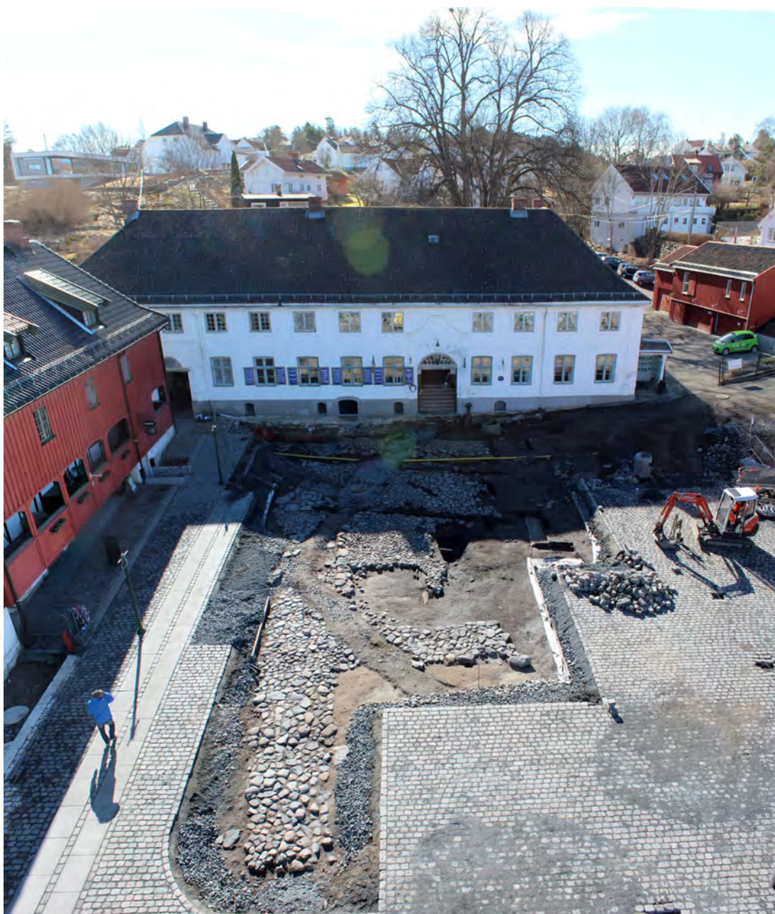
Figur 7: Torget i Son, delvis tildekket etter undersøkelsene. Den hvite bygningen bak i bildet er Thornegården fra 1761, til venstre sees litt av Spinnerigården (opprinnelig tobakksspinneri) fra ca. 1769. I det åpne feltet foran bygningene sees en oppbygd, steinbrolagt flate og steinbrolagte gater, trolig fra slutten av 1600-tallet. Deler av en gate fra 1700-tallet kan skimtes foran Thornegården.