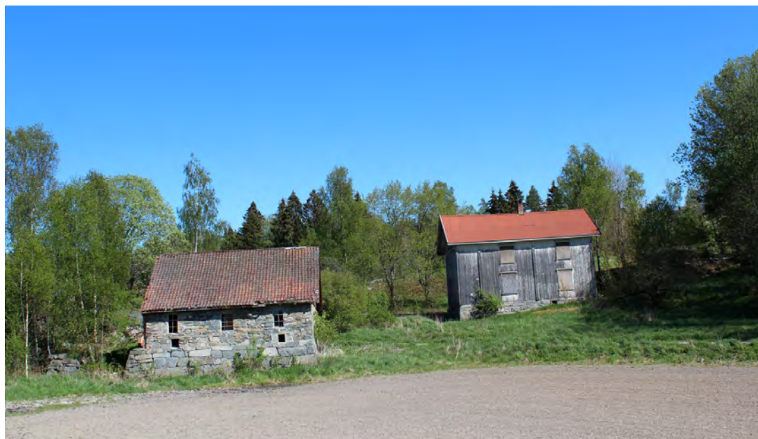
Figur 2: Ubebodde hus på Søndre Labo gård. Mellom og på baksiden av disse to husene ble det funnet en boplass som hadde vært i bruk sammenhengende fra 800- til 1700-tallet.

For den eldste historien om området er de skriftlige kildene få og meget magre. Til gjengjeld gir stedsnavn et klart inntrykk av sjøens og elvas og dermed sjøfartens sentrale betydning for Son langt tilbake i tid. Og det arkeologiske materialet viser at gården Labo har vært noe langt mer enn en vanlig bondegård i tidligere tider.