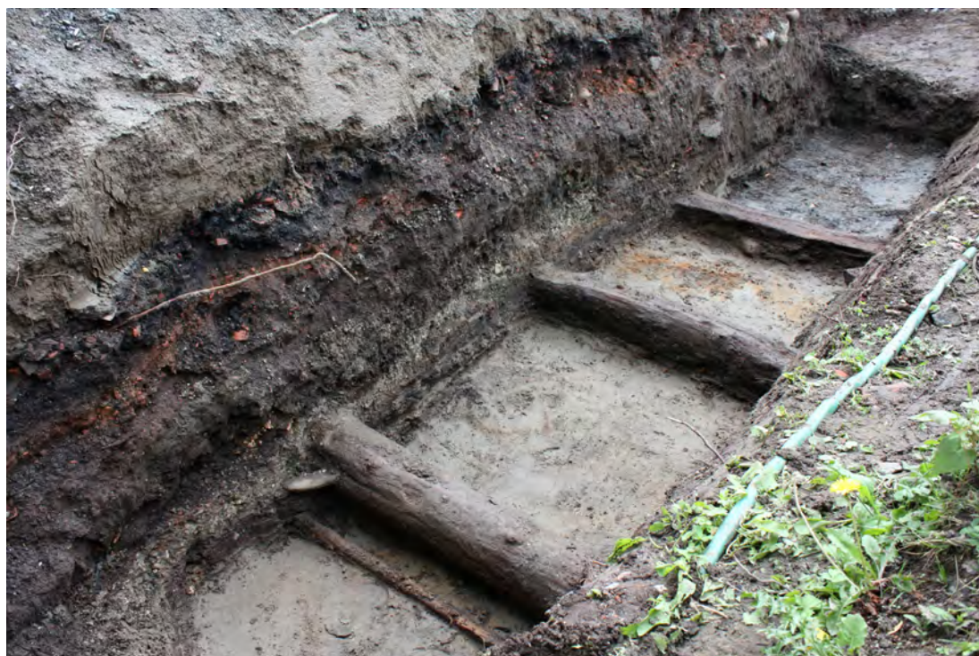
Figur 5: Bolverk under Glenneparken, sentralt i Son.

De øvre delene av hver tomt besto av fjell og stein som gjorde det mulig å sette bolighusene på fast grunn, og å forankre andre byggverk i knausene. Men brygger og sjøboder måtte legges så langt ut mot dypet i Sonskilen som mulig, og til det trengte man å sikre og befeste sjøkanten – og helst også bygge den ut i vannet, så båter og i gunstige tilfeller også skip kunne legge til der. Middelet til å oppnå dette var bolverk – tømmerstokker lagt i store ruter med forskjellige fyllmasser. I Son ligger de i ett eller to omfar (lag), for å stabilisere grunnen på stranden eller for å bygge seg utover i sjøen og slik utvide en tomt (se fig. 5).