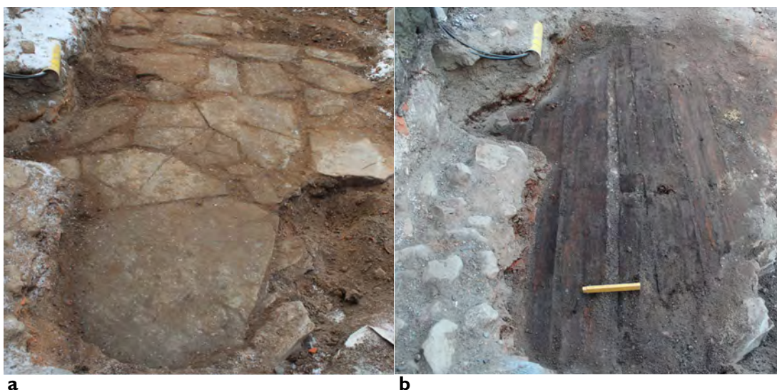
Figur 6a-b: Gulvet som ble funnet under Storgata, foran den nåværende Stoltenberggården. a. Steingulvet. b. Plankegulvet.

Midt i det som nå er Storgata, foran det som siden 1800-tallet har blitt kalt Stoltenberggården (Storgata 26), ble det i sammenheng med de arkeologiske undersøkelsene funnet bygningsrester som beviser at gata i utgangspunktet ikke løp slik den gjør i dag. Funnene besto i et gully i hele gatas bredde og en grunnmur som går vinkelrett på grunnmuren til Stoltenberggården (se fig. 6). På utsiden av muren var det bevart et lite felt med brostein. Muren flukter med en mur som fortsetter inn i kjelleren til Stoltenberggården. Dette betyr at deler av Stoltenberggården står på en eldre grunnmur, eller at huset en gang ble bygget om for å la gata passere omtrent der den går i dag. Steingulvet var laget av store, flate steiner. På ett tidspunkt la man et plankegulv oppå steingulvet som også var bevart. Det ble ikke gjort så mange gjenstandsfunn som kan datere byggingen av dette huset ut over noen krittpestilker. Ut fra det kan vi si at huset nok ikke er eldre enn en gang på 1600-tallet, men ikke noe mer. 27