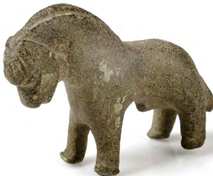
Figur 3: «Labohesten»: Vektlodd av bronse fra Håkon den femtes tid (1270–1319), funnet på Labo. Vekt: ca. 100 gram. Nesten 100 slike vektlodd (flesteprocent hester, men også okser og bukker) er funnet i Norden, de fleste i Østnorge, foruten ett i England.