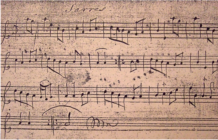
Figur 6: Faksimile av «Sarres» fra noteboka etter Truels Johannesøn Hvidt, Drammen 1722

Siste vendinga i denne springaren (f.o.m. siste taktslag i takt 26) har klare likhetstrekk med en sarres fra det eldste kjente, sekulære musikkmanuskriptet med norsk proveniens: Truels Johannesøn Hvidts notebok, datert 1722 og stedfesta til «Bragnes», altså Bragernes, dagens Drammen (Gorset 2011).