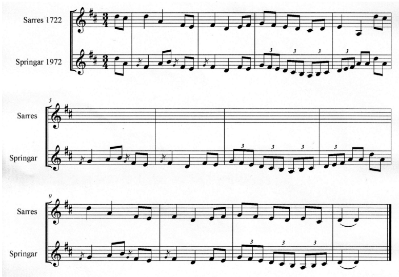
Figur 7: Første vending av Hvidts «Sarres» og tredje vending av «Springar etter Hellik Fossland» sammenstilt