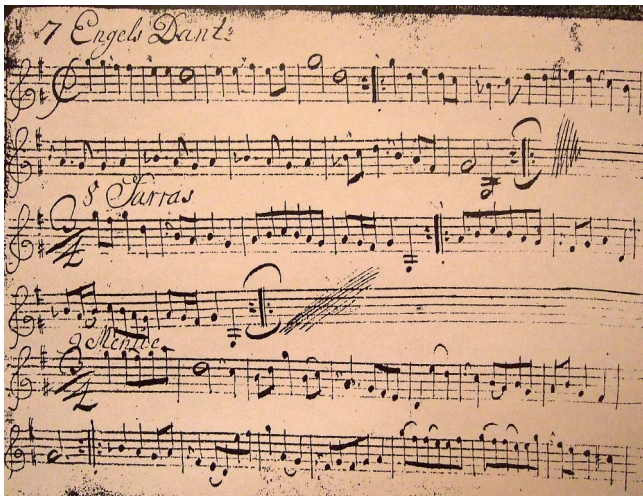
Figur 8: «Sarras». Faksimile av Peter Bangs notebok, ca. 1740