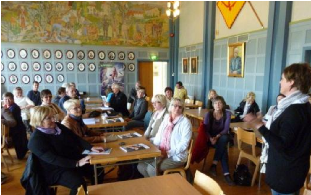
Figur 1. Rådgivere på fagdag om naturbruk.