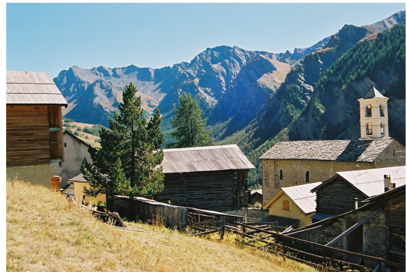
Fra Queyras regionale naturpark

Oppsummering og drøftingsnotat på bakgrunn av studietur til regionale naturparker i Frankrike 21. - 25. september 2004