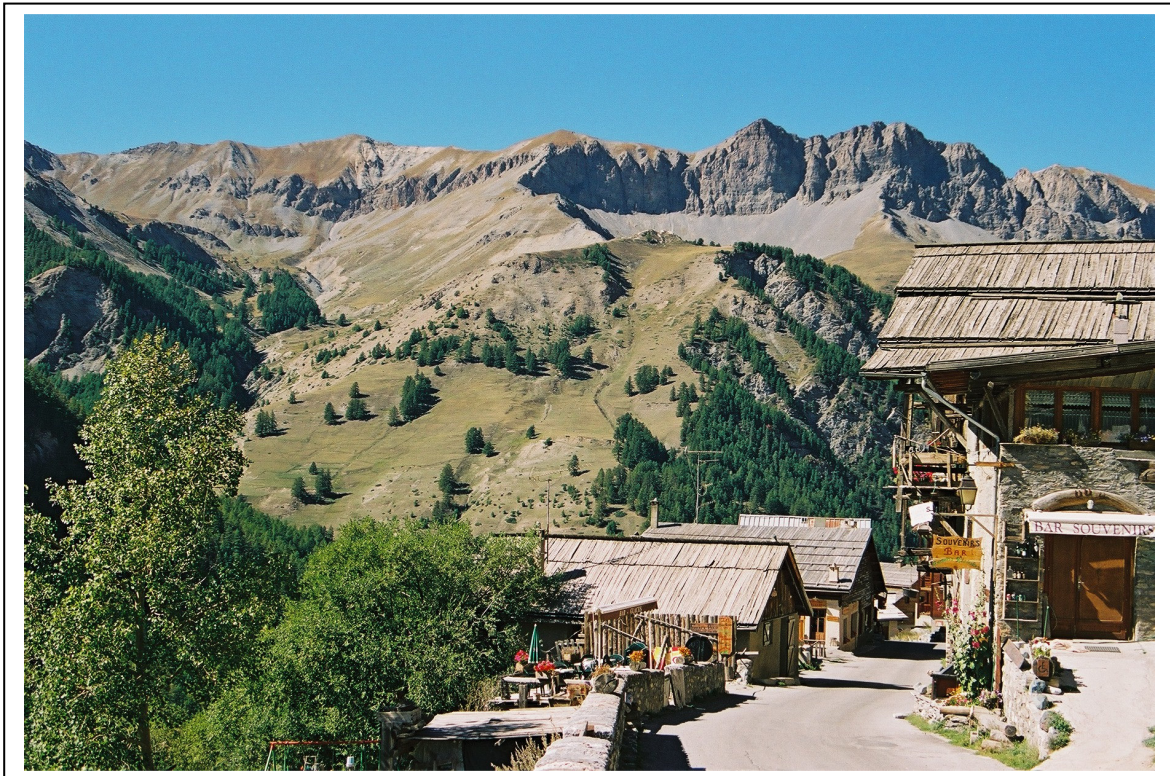
Fra Queyras regionale naturpark. Saint-Veran skal være Europas høyestliggende landsby (2040moh)

Ett av tre administrasjonssentra i Queyras ligger i landsbyen Arvieux. Her er også bibliotek og mediasenter. Bygningen er ny, men bygd i tradisjonell stil