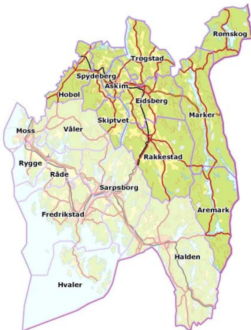
Figur 1. Kart over dagens Indre Østfold region med ti kommuner. Se www.indreostfold.no