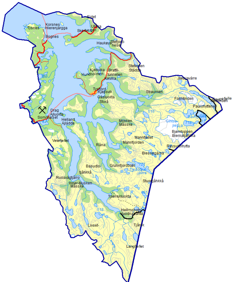
Figur 1 Kart over Tysfjord kommune.

Deling av Tysfjord var ikke ett av alternativene som ble utredet i rapporten, men var en mulighet som vi vurderte der det var naturlig gjennom arbeidet. I siste kapitlet i rapporten om sammenfattende konklusjoner ble det skrevet følgende om deling av Tysfjord: Det viktigste spørsmålet på nåværende tidspunkt Tysfjord må ta stilling til er hvorvidt en ønsker å fortsette med kommunen samlet som i dag, eller om en skal dele kommunen i øst og vest. Vårt inntrykk er at kommunegrensene i Tysfjord i stor grad er tilpasset en annen infrastrukturetid, hvor transportmiddelet var båt. Nå er det bil som gjelder, og med en ferjestrekning på en time mellom de to største tettstedene i kommunen er det ikke enkelt å drifte en kommune og å utnytte både faglige og økonomiske ressurser på en god måte. Uten at det i denne utredningen er gjort et inngående arbeid på deling av Tysfjord, så mener vi det er et høyst reelt alternativ det bør tas stilling til.