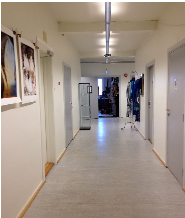
Figur 7 38

Kulturentreprenørenes ulike behov gjør det vanskelig for dem å samarbeide og å videreutvikle Nesoddparken i samme retning. Nesoddparken kan således ikke forstås som en kunstinstitusjon fordi kunsten ikke er i sentrum, og det kan heller ikke argumenteres for at det er en ren næringsklynge fordi kulturentreprenørene i liten grad utnytter potensialet ved det å være en næringsklynge. På den måten havner Nesoddparken og kulturentreprenørene i skjæringsfeltet mellom kunstdiskursen og næringsdiskursen.