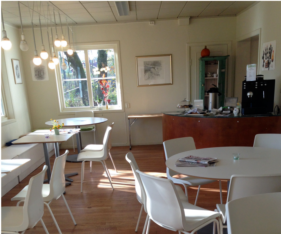
Figur 2 3