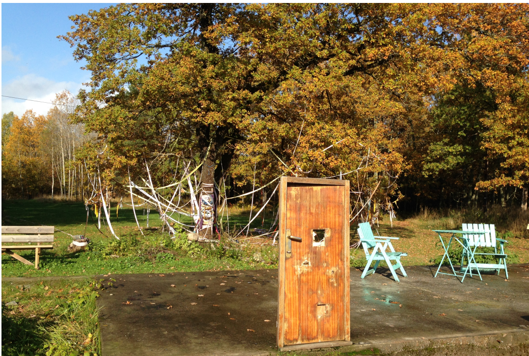
Figur 6 37

Det er problematisk at Nesoddparken som en kreativ næringsklynge befinner seg mellom en privat og en offentlig sfære, men sannsynligvis hadde det ikke eksistert en så stor kulturnæringsklynge på Nesodden om alt måtte skjedd på privat initiativ. Nesodden og Nesoddparken fungerer som hverandres motspillere og medspillere på en gang fordi de har felles ønsker og ser nytteverdien av å være i relasjon, for eksempel økonomisk og praktisk. Dermed er det utfordrende å avklare hvilke aktører som har hvilke roller og ansvar. Det at Nesoddparken befinner seg mellom ulike forståelser gjør også at Nesoddparkens identitet fremstår som udefinert og uklar. De ulike kulturentreprenørene har også ulike syn på Nesoddparken. Dette ser vi nærmere på i neste kapittel.