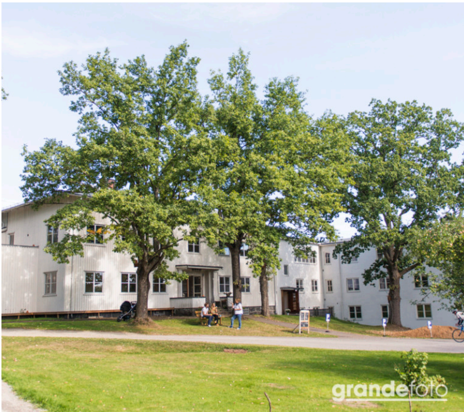
Figur 4 15