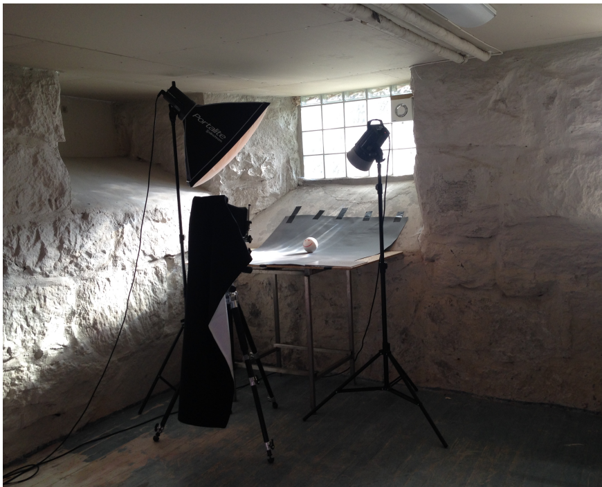
Figur 5 33

Nesodden kommune artikulereer altså Nesoddparken som et tiltak som blant annet skal synliggjøre kommunen, det skal gi lokale arbeidsplasser og være en ressurs for lokalbefolkningen. At Nesoddparken skal ha så mange forskjellige formål mener jeg gjenspeiler en offentlig kollektiv usikkerhet rundt hva kreative næringer egentlig er. I kommunens planer blir det for eksempel ikke eksplisitt gjort rede for hva de legger i begreper som kunstner, kreative næringer og kulturarbeider. Med andre ord har de ikke plassert disse gruppene forhold til blant annet økonomi, kunst og kreativitet, noe jeg mener kunne vært fruktbart nettopp fordi kulturentreprenørenes oppfatning av egen virksomhet og rolle er ganske ulike. Kommunens definisjon av disse begrepene er dermed uklar og lite nyansert fordi begreper som 'kulturarbeider' kan omfatte alt fra en karismatisk kunstner eller bibliotekar til en som jobber med å utvikle apper eller er skomaker. Men ut fra kommunens formål kan Nesoddparken i stor grad forstås ut fra en allmengjøringsdiskurs hvor velferd og den kulturelle grunnmuren står sentralt, men også en næringsdiskurs hvor arbeidsplasser og stedsidentitet er viktig.