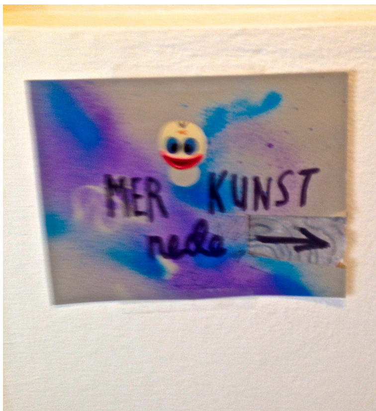
Figur 3 9

Alle informantene har godkjent informasjonsskrivet enten muntlig eller skriftlig. De har også godkjent sitater jeg har brukt i oppgaven.