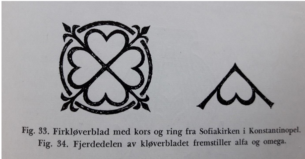
Fig. 33. Firkløverblad med kors og ring fra Sofiakirken i Konstantinobel.

Lysgloben er laget av stål og kleberstein. De formmessige referansene til lysgloben er fra Sofiakirken i Konstantinobel.