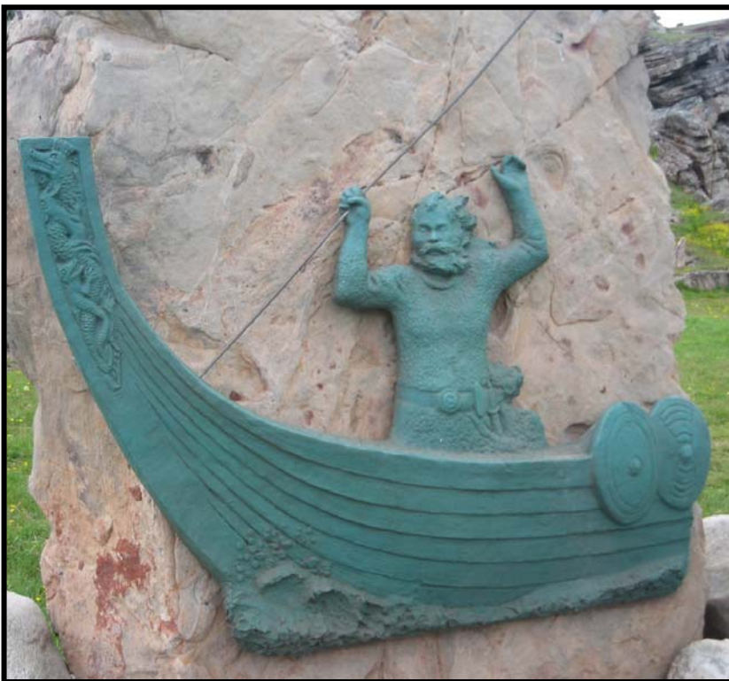
Figur 2 Monument over Eirik Raude