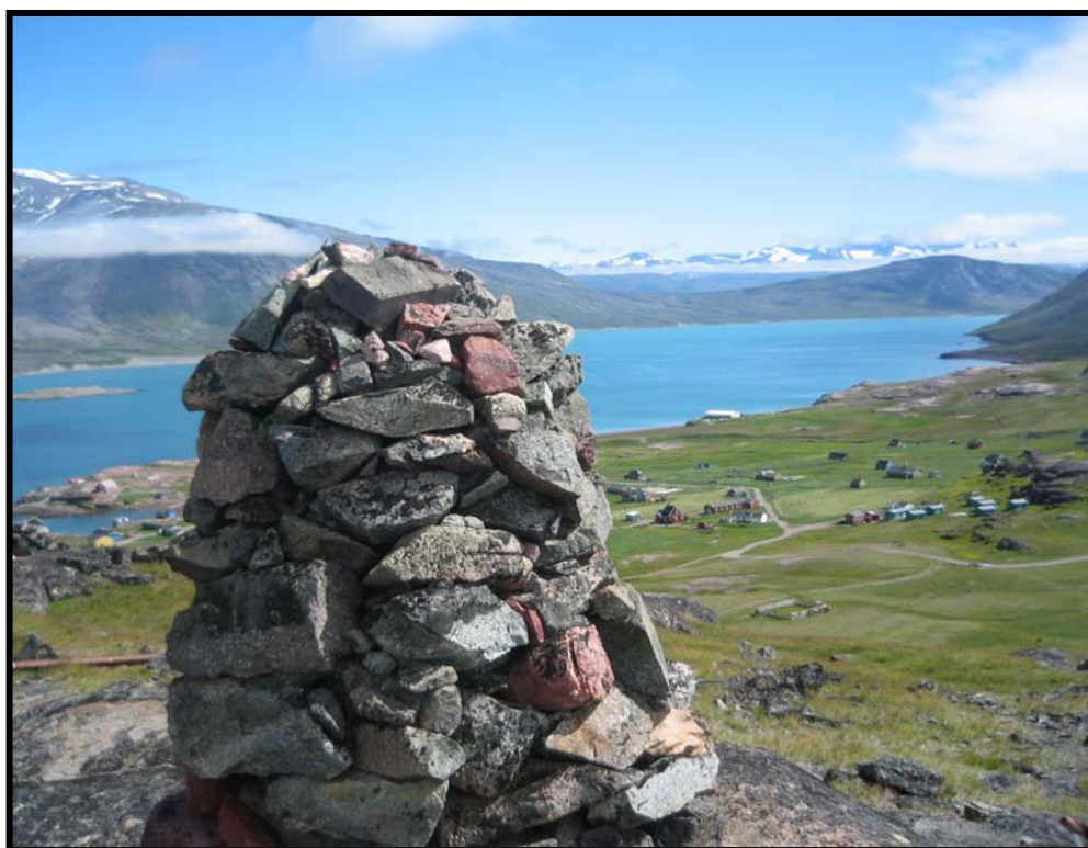
Figur 6 Bildet viser utsyn over Gardar.