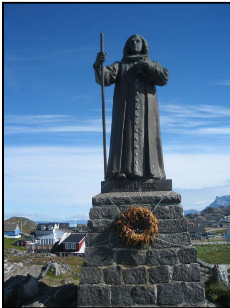
Figur 8 Bildet viser statue av Grønlands første misjonær Hans Egede, Godthaab (Nuuk)

Noe eksakt årstall for når den norrøne befolkningen forsvant har man ikke, men vi vet at det har vært folk av norrøn avstamning så sent som på 1500-tallet. Men på Vesterbygd var den norrøne stammen forsvunnet allerede på 1360-tallet.