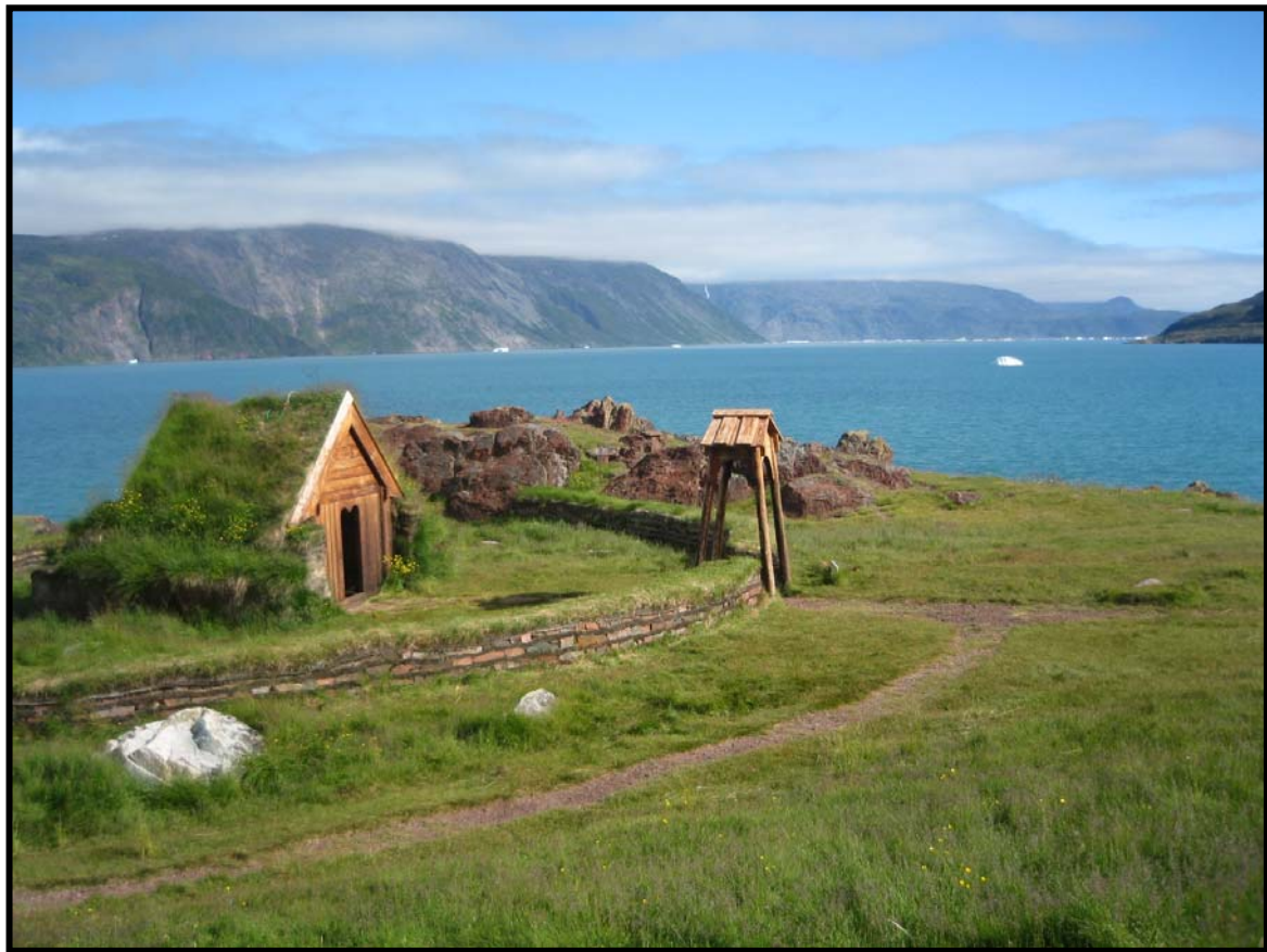
Figur 4 Bildet viser en rekonstruksjon av en norrøn kirke

Forbindelsen med utenverden ble i den første tiden knyttet opp mot handelen, senere ble også forbindelsen forsterket ved kirkens hjelp. Grønlendingene solgte store mengder hvalrosstener og pelsverk til gode priser. Hvalrosstennene ble ifølge Helge Ingstad i Europa brukt til krusifikser, skrin, bispestaver, sjakkbrikker, jakthorn osv. De viktigste importerte varene til Grønland var ifølge Kongespeilet jern og tømmer. Tømmerets betydning er tidligere gjort rede for. Jernet kunne nyttes til økseblad, knivblad, harpun osv. Det er riktignok gjort funn av smier på Grønland, noe som tyder på at de har produsert jern av myrmalm. Denne produksjonen har nok vært så krevende at den ikke har dekket etterspørselen av jern. Derfor var det påkrevet med import av metallet.