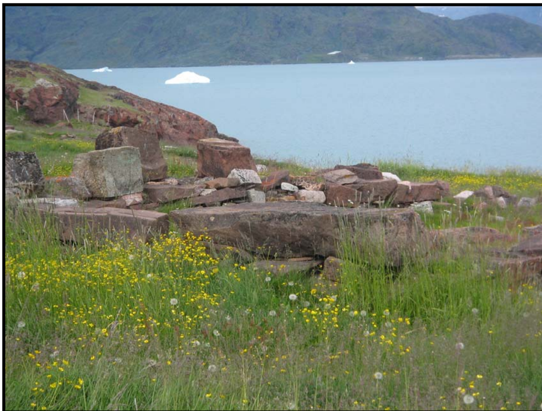
Figur 3 Bildet viser restene av norrøne bosetning.

De få som er igjen på Brattalid lever av litt turisme og noe landbruk. Husene ser slitne ut og beboernes rytme synes for oss utenforstående å se ganske så behagelig. At det for 1000 år siden lå et høvdingsete her er det med en gang ikke så enkelt å forestille seg. Men dersom vi bruker litt av vår kunnskap om dette samfunnet, er det likevel ikke så vanskelig å mane frem et bilde av et aktivt norrønt samfunn i de omgivelsene vi står på. Her ser vi ruinene av Eiriks høvdingsete, restene av en kirke og ikke minst det frodige grønne landskapet som omgir oss i alle kompassretninger og fjorden med sine skjulte fiskereserver.