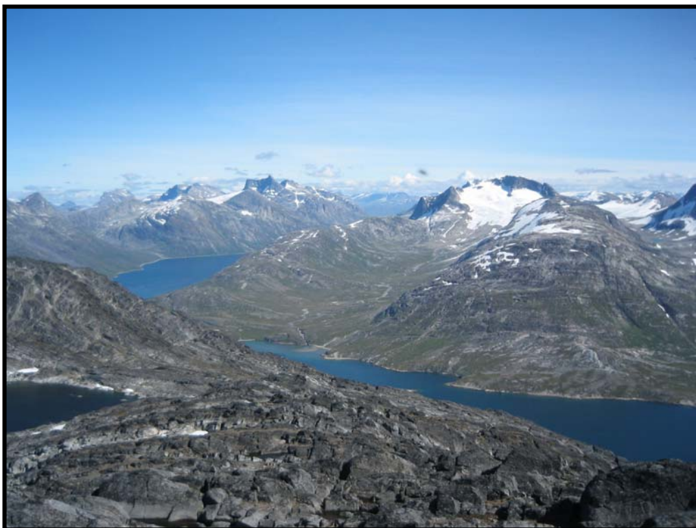
Figur 9 Innerst i Godthaabsfjorden lå gården Sandnes der Torfinn Karlsevne holdt til.

Et utgangspunkt er å se undergangen i et langsiktig perspektiv. En viktig forutsetning er hva som skjer i Norge på 1300-tallet. Etter at Grønland frivillig la seg under Norge i 1261 ble Norge det faste bindeleddet for Grønland. Alt salg av grønlandske varer gikk med norske handelsskip. I tillegg var kirkesamfunnet på Grønland underlagt erkebiskopen i Nidaros. Kirken var som nevnt ikke bare opptatt av religiøse spørsmål, men hadde også økonomiske interesser. Handelsskip som var utrustet av kirken var et viktig bidrag for å holde forbindelsen med Grønland ved like.