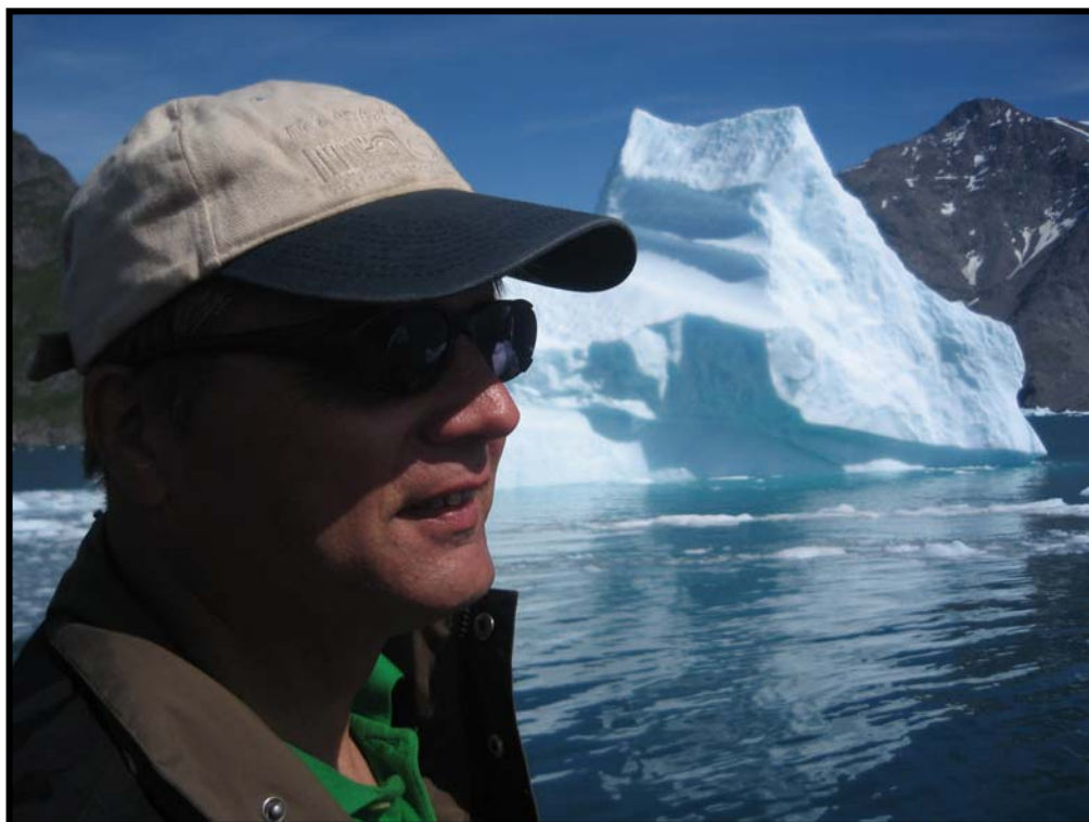
Figur 5 Bildet viser forfatteren som skuer mot Gardar