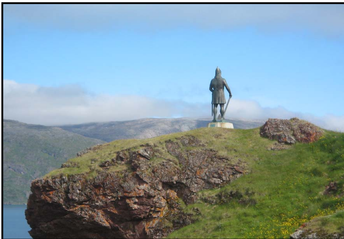
Figur 7 Statue av Leiv Eiriksson, reist 1000 år etter hans oppdagelse av Vinland.

Allerede den første sommeren kom de i kontakt med de innfødte ”skrælingene”. De ønsket å bytte til seg våpen, men det nektet Torfinn Karlsevne. Det ble melk. På det andre besøket forsøkte en av de innfødte å stjele våpen, men han ble raskt tatt av dage og forholdet mellom de to folkegruppene kjølnet. Da de kom for tredje gang var Torfinn Karlsevne forberedt på kamp og kamp ble det. Etter dette var det nok en lett beslutning å heise seil og vende tilbake til Grønland. Så langt Grønlandssagaen.