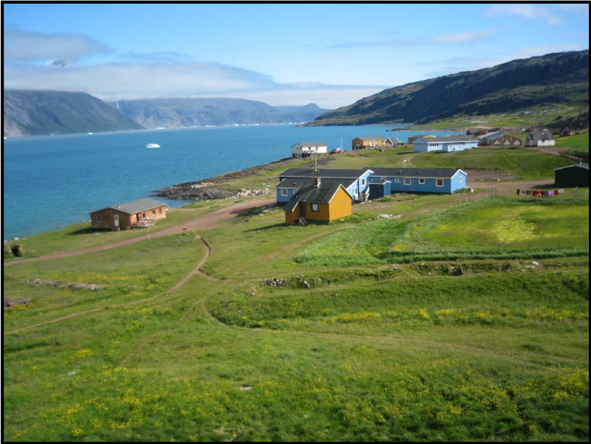
Figur 1. Bildet viser Brattalid i dag.