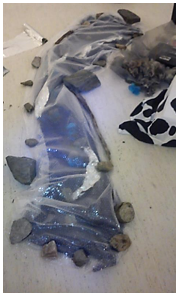
Figur 3. Visualisering av ei forureina elv (foto 5; studentgruppe 6).

Som betraktar såg ein noko blått som låg under eit stykke bobleplast, der steinar låg oppå platen. Bobleplast blir i kvardagen brukt for å pakke inn diverse ting ein skal beskytte. Betraktaren kan lure på kva som ligg under platen/ kva skal beskyttast – og dermed lure på kva som er tydinga med denne samanstillinga. Når steinar ligg oppå eit plaststykke på denne måten, kan det sjå ut som at steinane skal hindre platen i å fly vekk. Såleis blei det vanskeleg for utanforståande å tolke det studentane hadde laga som ei elv – og vidare kople samanstillinga til foto av røyk og fabrikkutslepp som studentane hadde hengt på veggen bak.